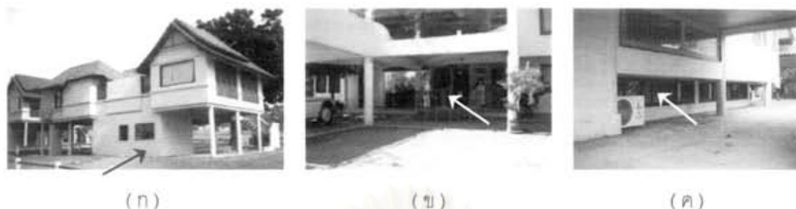
ภาพที่ 5.6 การใช้ประโยชน์บริเวณใต้ถุนโดยการกันส่วยใช้สอยบางส่วน

ตารางที่ 5.6 แสดงความคิดเห็นเกี่ยวกับคุณค่าลักษณะไทยภาคกลางสมัยใหม่ในด้านการใช้ประโยชน์บริเวณใต้ถุนโดยการกันส่วยใช้สอยบางส่วน