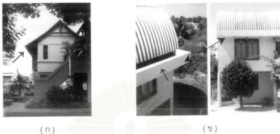
ภาพที่ 5.9 การยื่นชายคาสั้น

ตารางที่ 5.8 แสดงความคิดเห็นเกี่ยวกับคุณคาลักษณะไทยภาคกลางสมัยใหม่ในเรื่องการยื่นชายคา