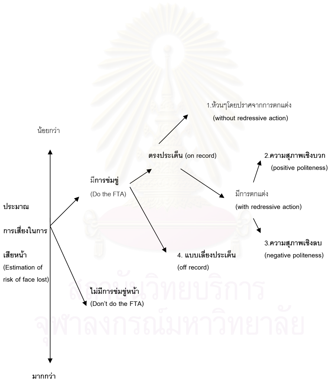
แผนภูมิที่ 1 แสดงการเลือกกลวิธีการใช้ภาษาสุภาพในการรักษาหน้า (Brown & Levinson, 1978: 74)

คาดคะเนว่า คำพูดของตนจะก่อให้เกิดการเสียหน้ามากที่สุด ก็อาจจะเลือกกลยุทธ์ประเภทที่ 4 คือ การพูดอ้อมค้อม แต่ถ้าคาดว่าคำพูดของตนจะทำให้เสียหน้าน้อย ก็อาจจะเลือกกลยุทธ์ประเภทที่ 1 คือพูดหัวนๆโดยไม่มีการตักตแต่ง หรืออาจจะเลือกกลยุทธ์อื่นๆก็ได้ กลยุทธ์การใช้ภาษาสุภาพแบ่งเป็น ลักษณะต่างๆดังนี้