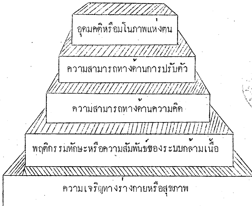
ภาพที่ 1 แสดงโครงสร้างบูรณาการแห่งบุคลิกภาพ

อิทธิพลของโครงสร้างบูรณาการแห่งบุคลิกภาพที่มีต่อพฤติกรรมของมนุษย์นั้น คลอสส์แมร์ แยกกล่าวถึงแต่ละด้านตามลำดับดังนี้ ด้านสุขภาพและพฤติกรรมทักษะกล่าวไควว่าความบกพร่องในด้านหนึ่งด้านใดหรือหลาย ๆ ด้านของพฤติกรรมทักษะอาจก่อให้เกิดการขัดขวางบูรณาการทางบุคลิกภาพของบุคคล การที่บุคคลไม่สามารถใช้หรือแสดงทักษะทางร่างกาย อาจเป็นสาเหตุหนึ่งที่ทำให้บุคคลที่มีพฤติกรรมไปทางก้าวร้าวหรือในทางที่ขัดต่อความต้องการของสังคมได้ ดังนั้นการศึกษามุขภาพจึงควรมุ่งเน้นถึงลักษณะทางกายภาพ สุขภาพ และทักษะในด้านการใช้ความสัมพันธ์ของระบบกล้ามเนื้อของบุคคลด้วย