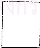
ขนาดเล็ก