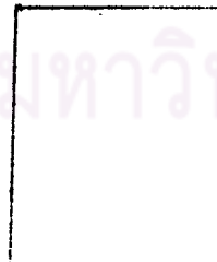
ขนาดกลาง