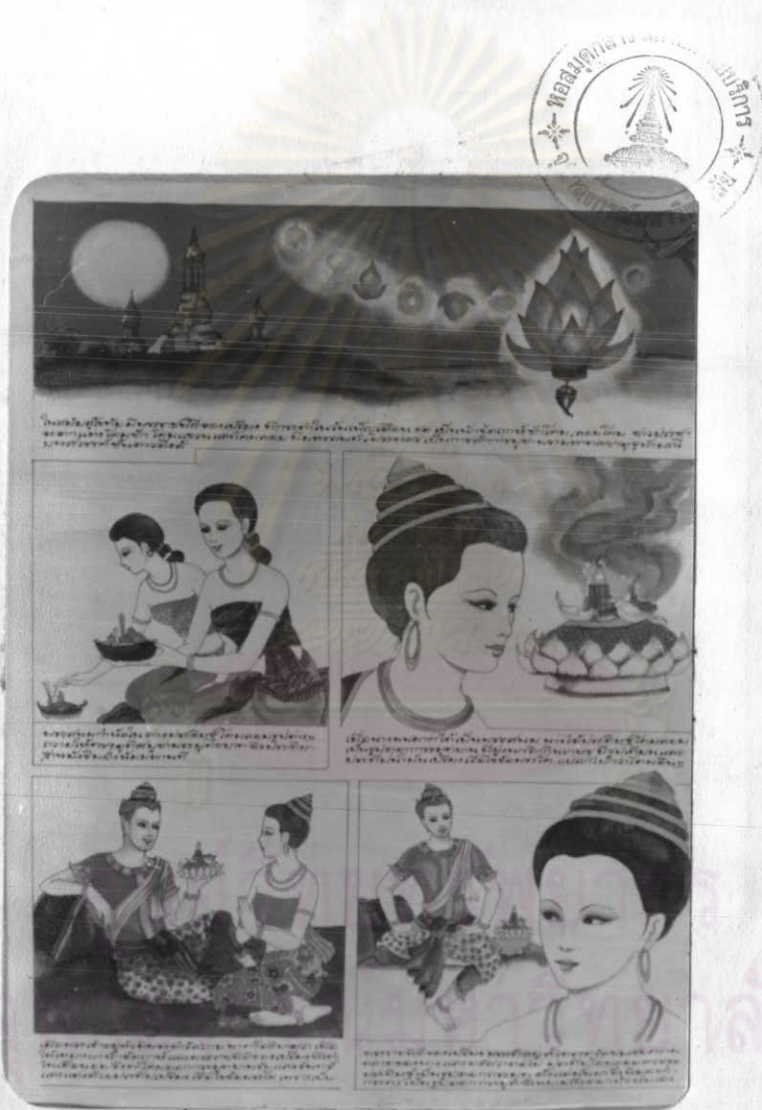
ภาพสี่ (ภาพวาดเหมือน)