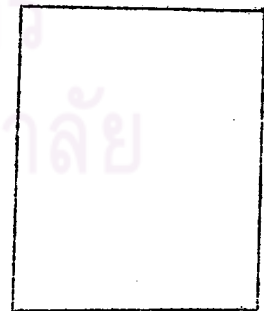
ขนาดใหญ่