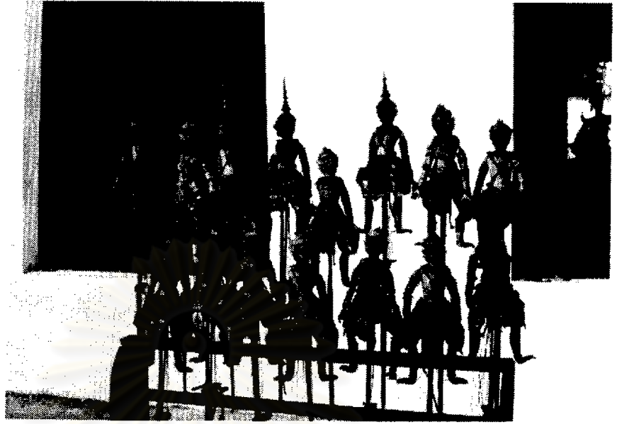
หุ่นไทย ปีพระหัตถ์กรมพระราชวังบวรวิชัยชาญ