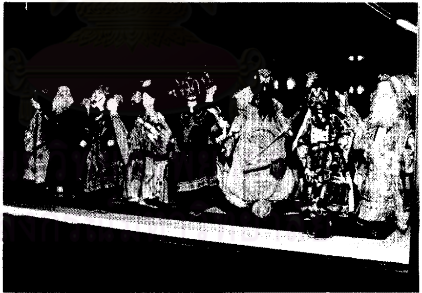
หุ่นจีน ปีพระหัตถ์กรมพระราชวังบวรวิชัยชาญ