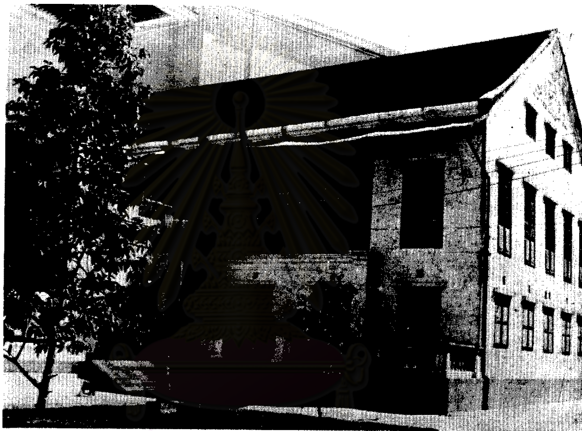
พระที่นั่งอิศเรศราชานุสรณ์ ของพระบาทสมเด็จพระปิ่นเกล้าเจ้าอยู่หัว ที่ทรงสร้างเลียนแบบสถาปัตยกรรมของประเทศทางตะวันตก