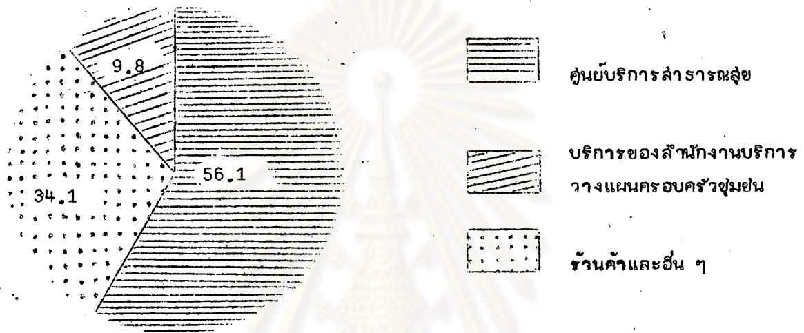
รูปที่ 8 แสดงแหล่งที่มาของข่ามีดคุมกำเนิดที่ใช้ในภาคเหนือ