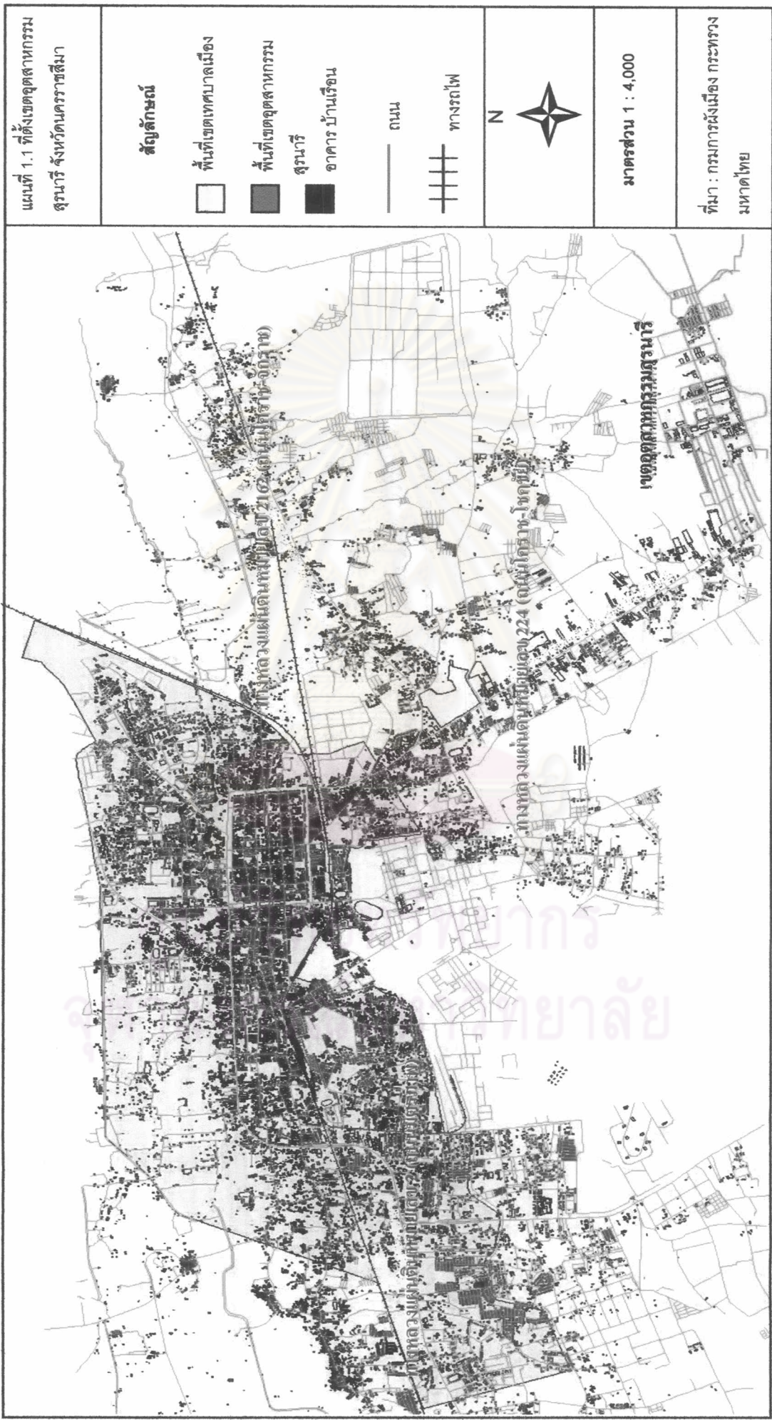
แผนที่ 1.1 ที่ตั้งเขตอุตสาหกรรม สุวรรณภูมิ จังหวัดนครราชสีมา