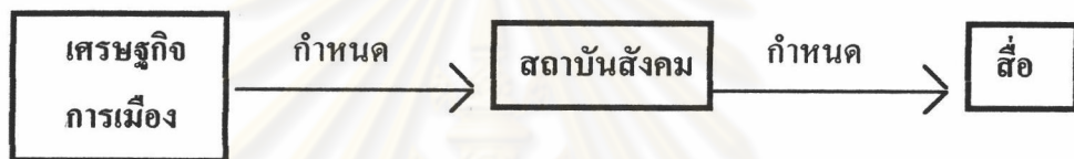
รูปภาพที่ 1. ความเชื่อมโยงของเศรษฐกิจกำหนดสถาบันสังคมและสถาบันสังคมกำหนดสื่อ

เมื่อเป็นเช่นนี้ลองมาโยงเทียบกับภาพยนตร์ไทย จะได้ดังนี้