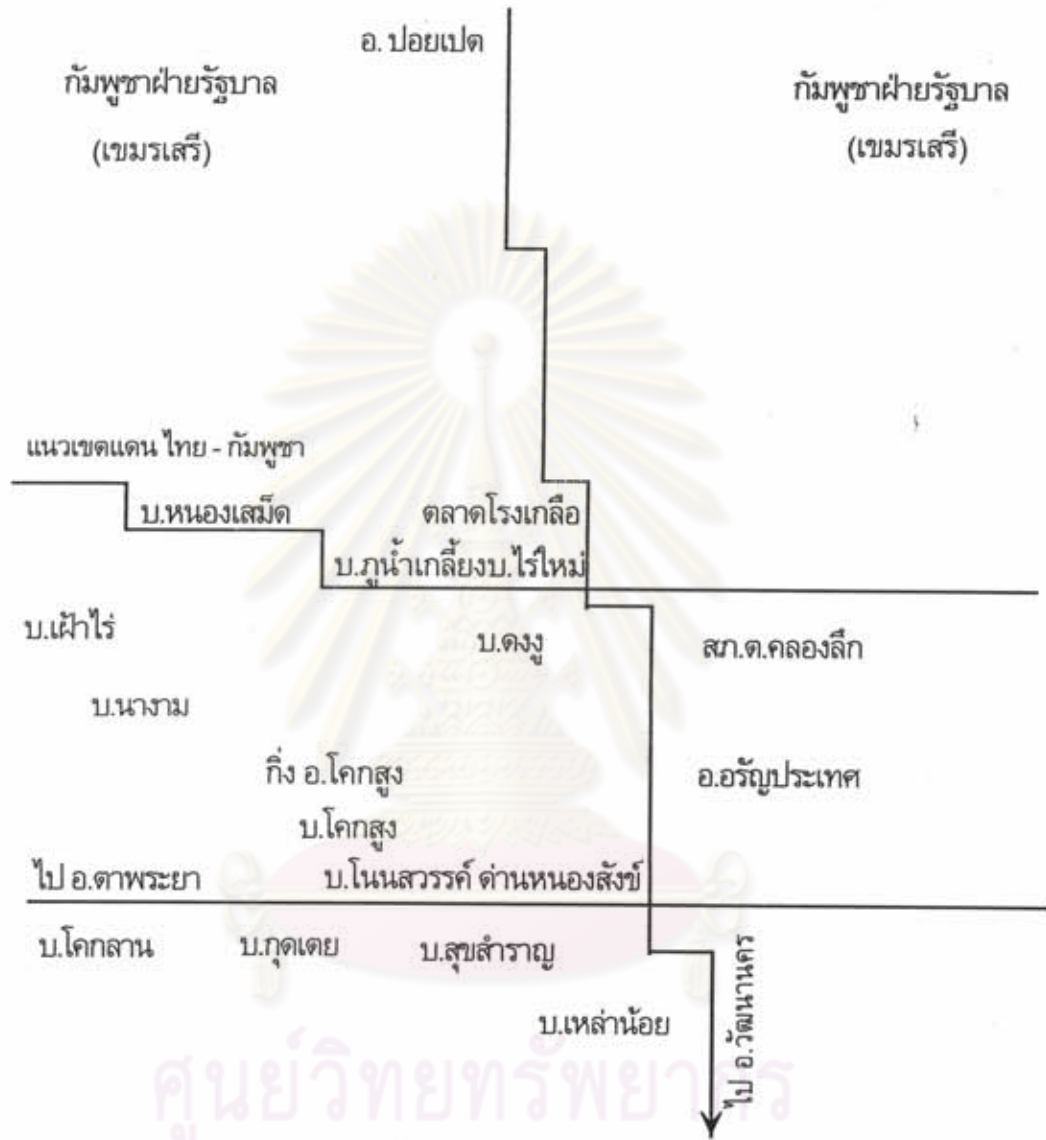
แผนที่ 3.3 ให้เห็นพื้นที่ที่คนร้ายนำรถออกมากที่สุด เพราะมีเส้นทางติดต่อกับประเทศกัมพูชา