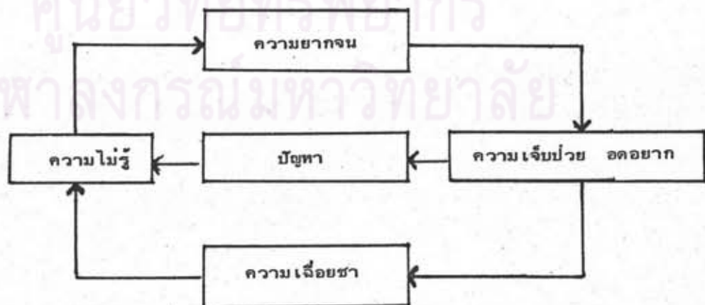
แผนภาพแสดงวัฏจักรแห่งความชั่วร้าย