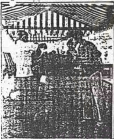
ถ.ค.ถ. ๒๕๑๐ แต่

๑๗ มี.ค. ๒๕๑๐ วันหยั่งเสียงประชามติ (๘.๐๐-๑๕.๐๐ น.) ขยายเขตเทศบาล เมืองนครศรีธรรมราช