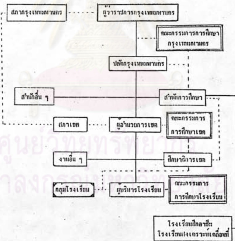
แผนภูมิ 3 การบริหารการศึกษาของกรุงเทพมหานคร