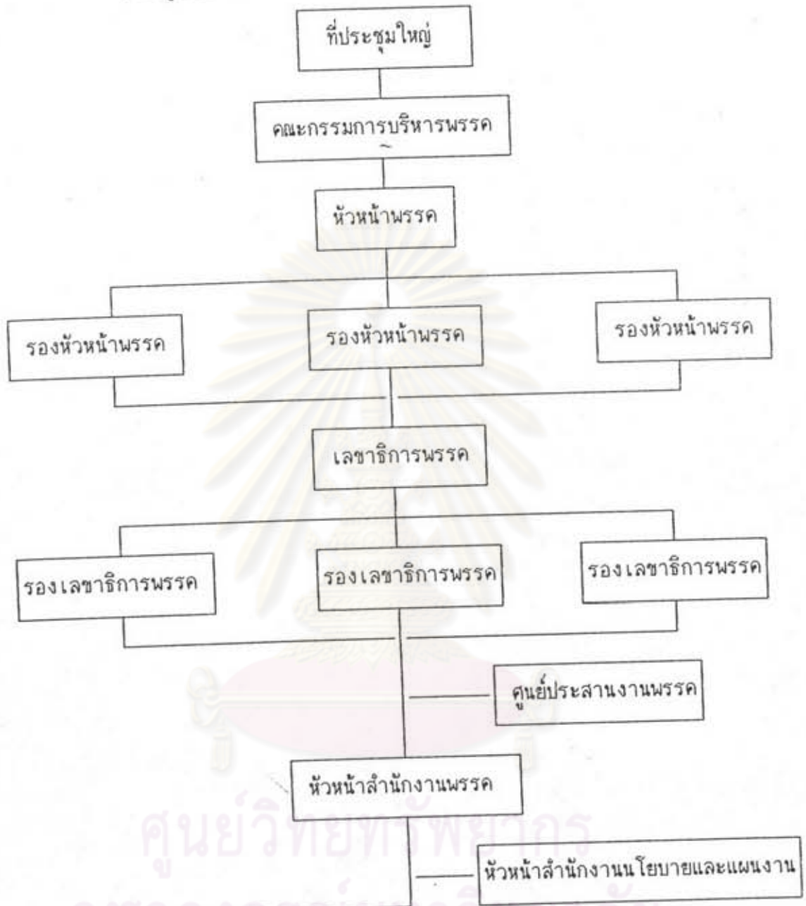
แผนภูมิที่ 4.1 แสดงโครงสร้างการบริหารพรรคพลังธรรม