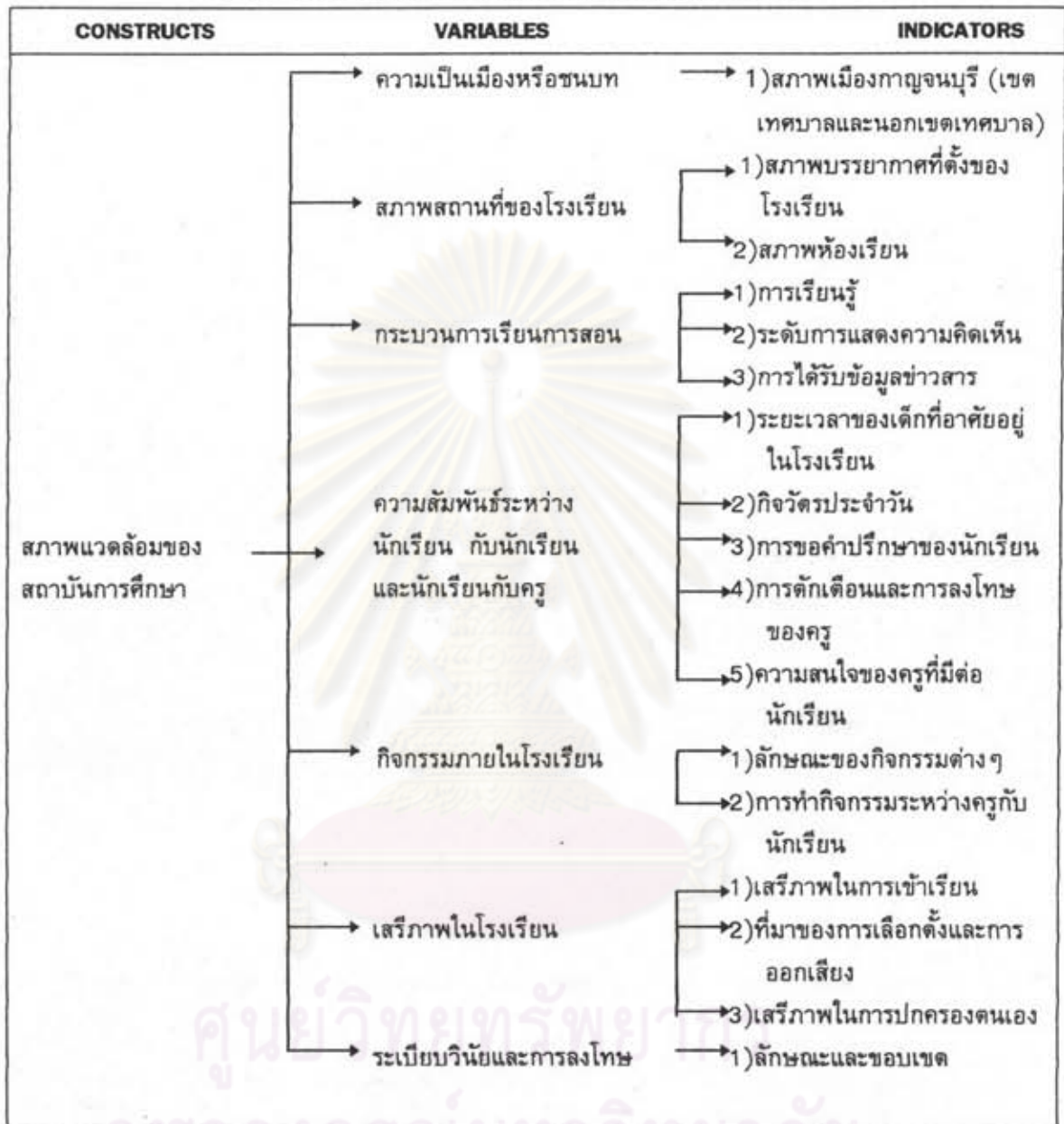
ภาพ 1.2 โครงสร้างสภาพแวดล้อมของสถาบันการศึกษา

หมายเหตุ :- การได้มาของข้อมูลในส่วนนี้ผู้วิจัยจะใช้วิธีสัมภาษณ์จากครู-อาจารย์ หรือผู้ที่เกี่ยวข้องเป็นหลักซึ่งวัตถุประสงค์ก็เพื่อที่จะดูว่าสภาพแวดล้อมของสถาบันการศึกษา จะมีผลต่อการเอื้ออำนวยต่อความเป็นประชาธิปไตยของเด็กหรือไม่