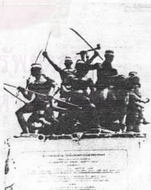
อนุสาวรีย์วีรชนค่ายบางระจัน อ.บางระจัน จ.สิงห์บุรี