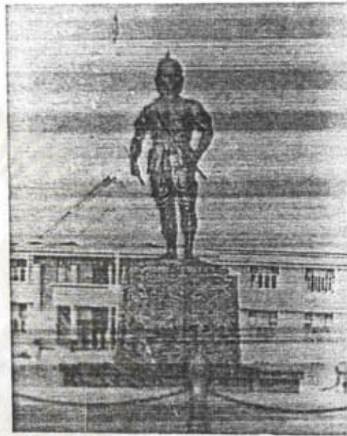
อนุสาวรีย์พระยาพิชัยดาบหัก อ.เมือง จ.อุตรดิตถ์