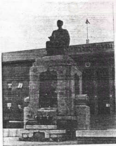
อนุสาวรีย์กรมหลวงราชบุรีดิเรกฤทธิ์ หน้ากระทรวงยุติธรรม กรุงเทพฯ