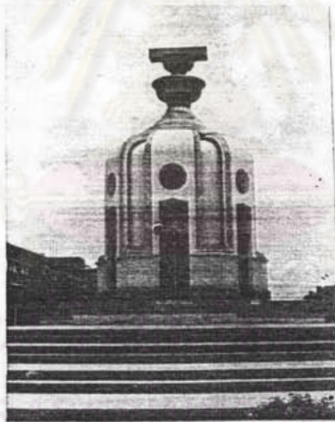
อนุสาวรีย์ประชาธิปไตย ถนนราชดำเนินใน กรุงเทพมหานคร