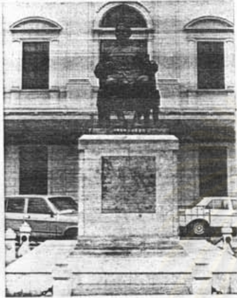
อนุสาวรีย์กรมพระจันทบุรีนฤนาถ หน้ากระทรวงพาณิชย์ กรุงเทพฯ