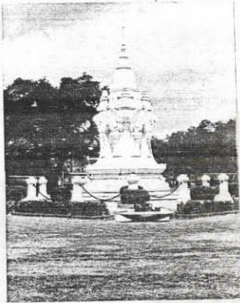
อนุสาวรีย์ทหารอาสา สนามหลวงด้านทิศเหนือ กรุงเทพฯ