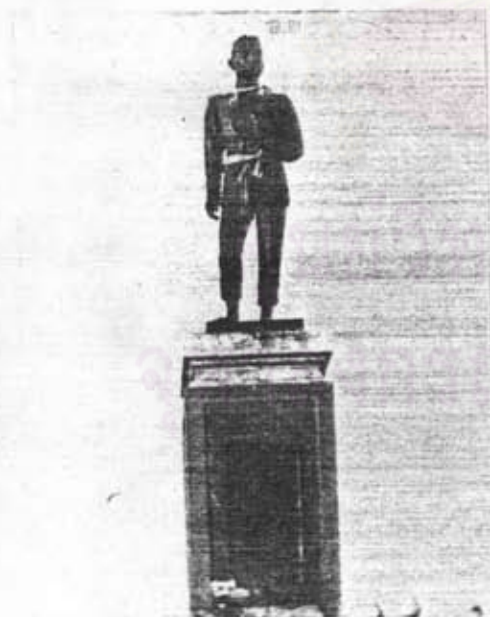
อนุสาวรีย์พระยาภักดีชุมพล (เจ้าพ่อพระยาแล) อ. เมือง จ. ชัยภูมิ