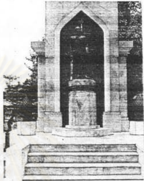
อนุสาวรีย์รัชกาลที่ 6 กรมการรักษากินแดน กรุงเทพฯ