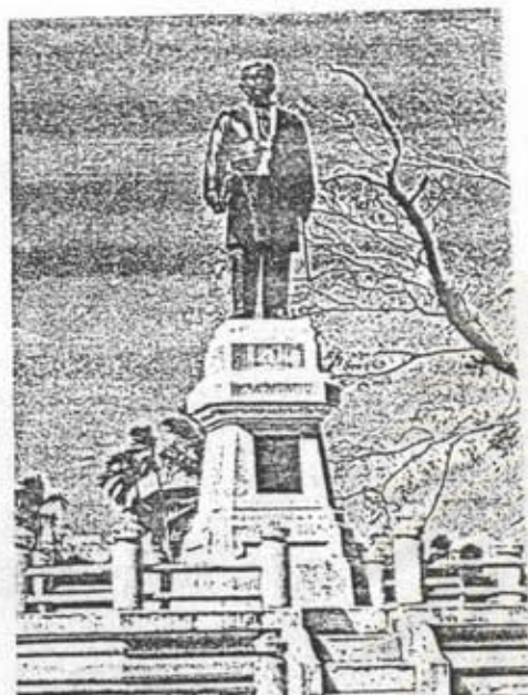
อนุสาวรีย์พระยาธรรมาธิปัตย์ (ค.ศ. ๒๓๖๖) จ. กว่าง