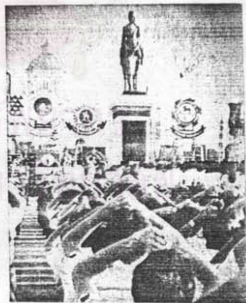
อนุสาวรีย์รัชกาลที่ 5 (พระบรมรูปทรงม้า) ในพิธีถวายบังคมและวางพวงมาลา 23 ตุลาคม