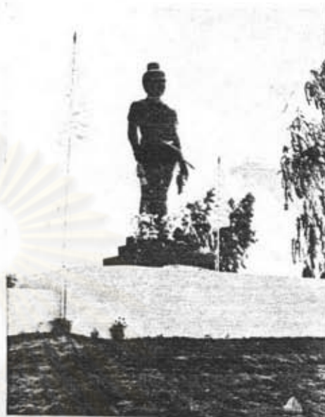
อนุสาวรีย์พ่อขุนผาเมือง อ.หล่มสัก จ.เพชรบูรณ์