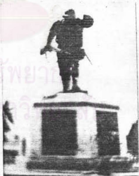
อนุสาวรีย์วีรชัย สมรภูมิท่าแพ จ.นครศรีธรรมราช