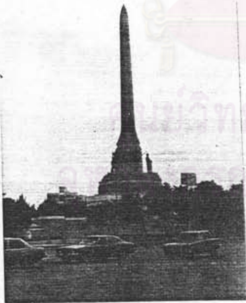
อนุสาวรีย์ชัยสมรภูมิ พญาไท กรุงเทพฯ