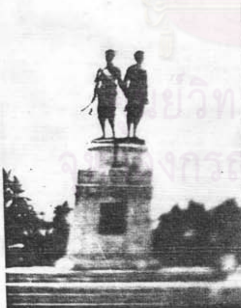
อนุสาวรีย์ท้าวเทพกษัตรี ท้าวศรีสุนทร อ.เมือง จ.ภูเก็ต