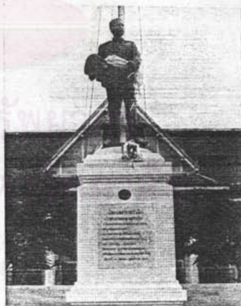
อนุสาวรีย์รัชกาลที่ 5 หน้าศาลากลางจังหวัดเพชรบูรณ์