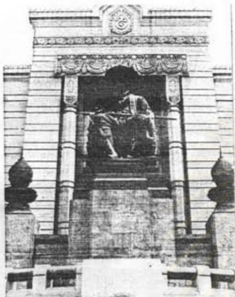
อนุสาวรีย์รัชกาลที่ 1 เชิงสะพานพุทธฯ กรุงเทพฯ