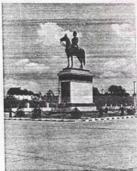
อนุสาวรีย์รัชกาลที่ 5 (พระบรมรูปทรงม้า) หน้าพระที่นั่งอนันตสมาคม กรุงเทพฯ