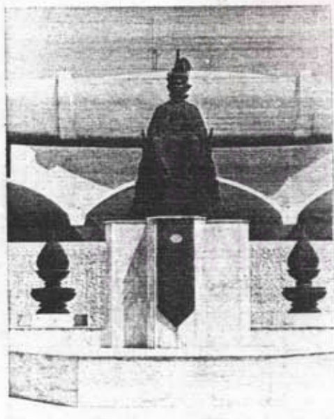
อนุสาวรีย์รัชกาลที่ 7 หน้าตึกรัฐสภาหลังใหม่ กรุงเทพฯ