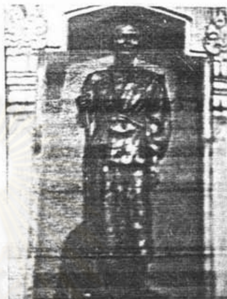
อนุสาวรีย์พระครูบาทูวิชัย เจียงคอบุสเทพ จ. เชียงใหม่