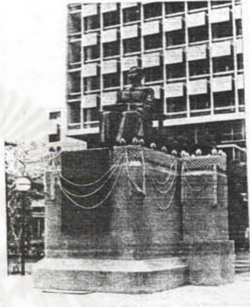
อนุสาวรีย์กรมหลวงสงขลานครินทร์ (พระบรม- ชนกนาถ) ศิริราชพยาบาล กรุงเทพฯ