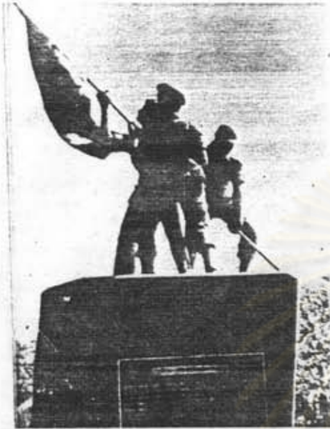
อนุสาวรีย์วีรกรรมพลเรือน ทหาร คำรวจ อ.ทุ่งช้าง จ.น่าน