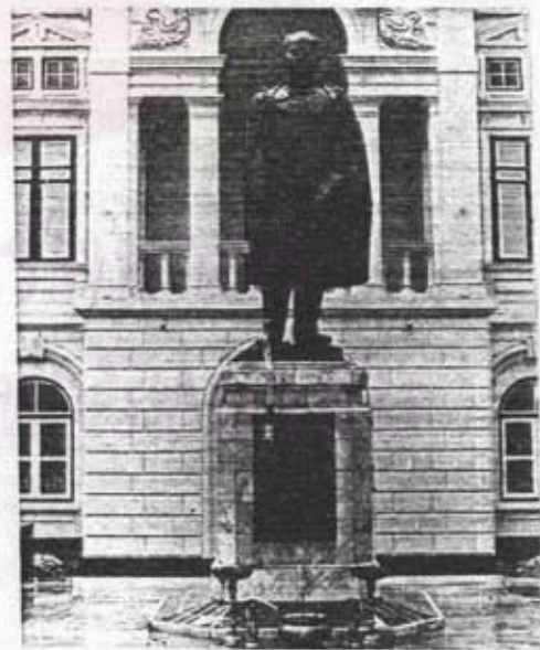
อนุสาวรีย์กรมพระยาเทววงศ์วโรปการ หน้ากระทรวงต่างประเทศ กรุงเทพฯ