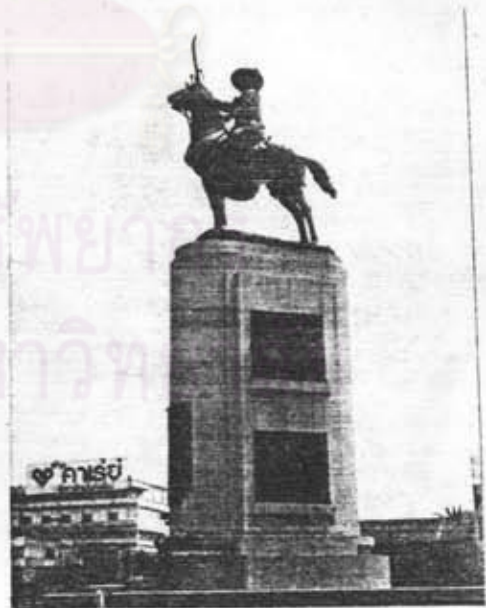
อนุสาวรีย์สมเด็จพระเจ้าตากสินมหาราช วงเวียนใหญ่ จ. รบบุรี