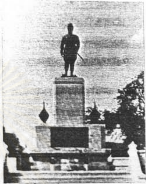
อนุสาวรีย์สมเด็จพระเจ้าอู่ทอง อ. เมือง จ. พระนครศรีอยุธยา