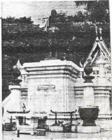
อนุสาวรีย์กรมพระราชวังบวรมหาสุรสิงหนาท อนุสาวรีย์กรมพระยากำรังราชานุภาพ วัดมหาธาตุฯ กรุงเทพฯ หน้ากระทรวงมหาดไทย กรุงเทพฯ