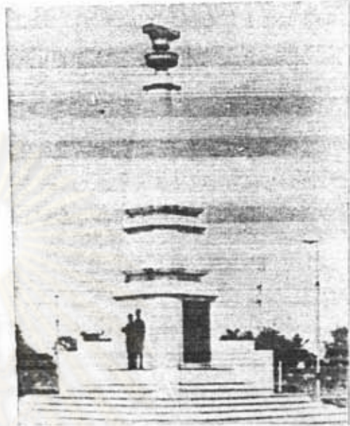
อนุสาวรีย์ปราบกบฏ (อนุสาวรีย์พิทักษ์รัฐ- ธรรมนูญ) หล้าสี่ กรุงเทพฯ