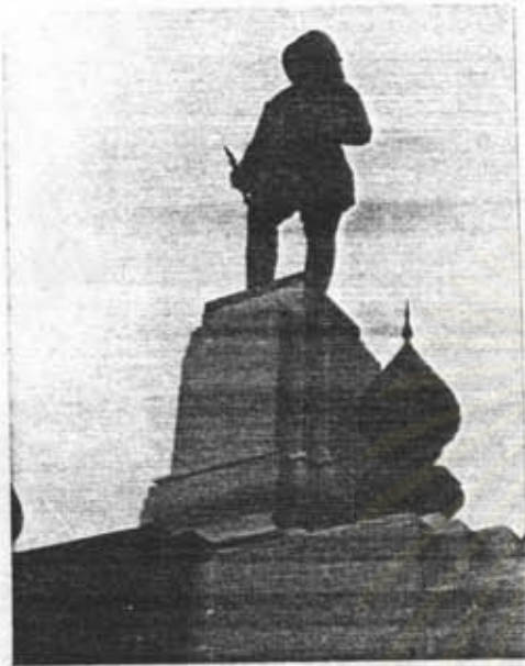
อนุสาวรีย์รัชกาลที่ 6 หน้าสวนลุมพินีฯ กรุงเทพฯ