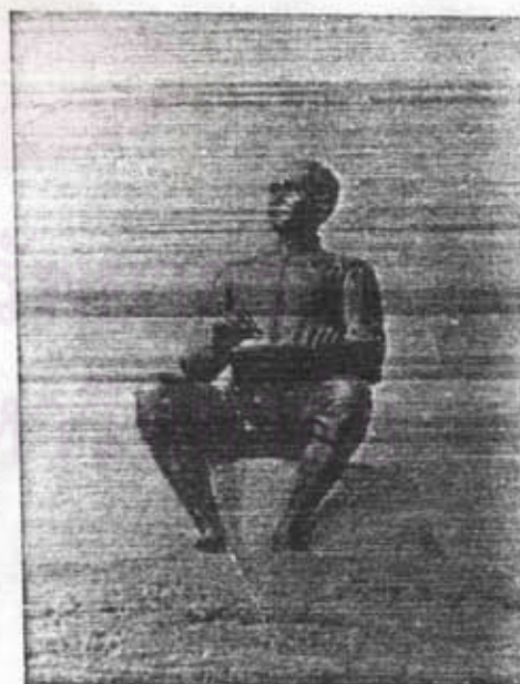
อนุสาวรีย์สุนทรภู่ อ. แกลง จ. ระยอง