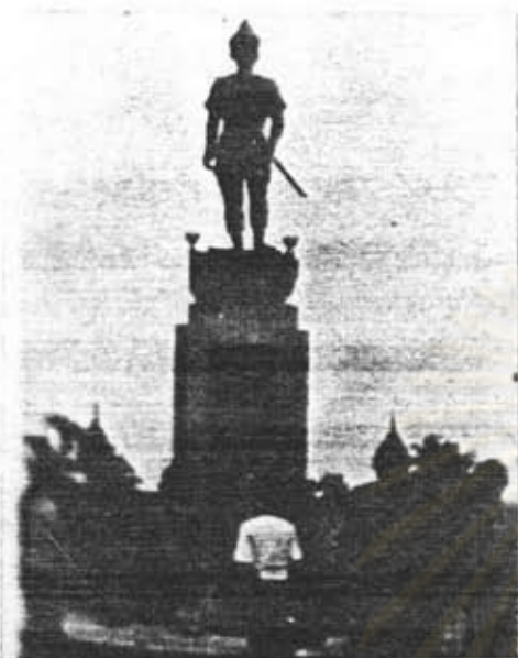
อนุสาวรีย์พ่อขุนเม็งราย อ.เมือง จ.เชียงราย