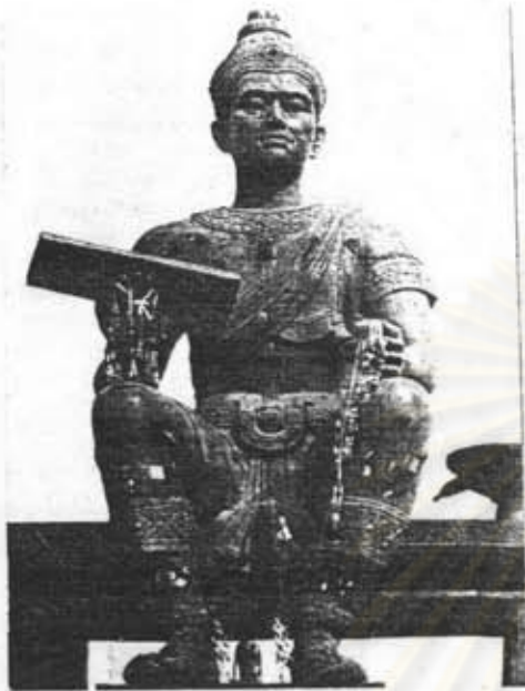
อนุสาวรีย์พ่อขุนรามคำแหงมหาราช ก. เมืองเก่า อ. เมืองเก่า จ. สุกโขทัย