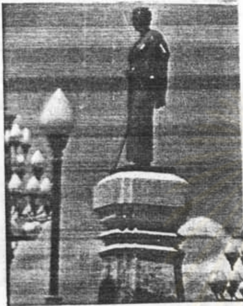
อนุสาวรีย์ท้าวสุรนารี (คุณหญิงโม) อ.เมือง จ.นครราชสีมา