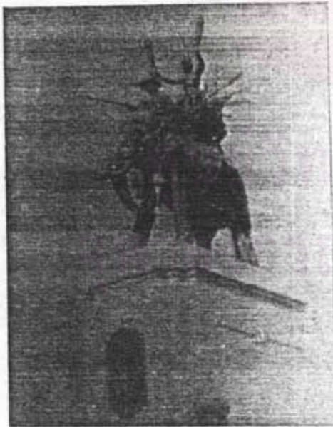
อนุสาวรีย์สมเด็จพระนเรศวรมหาราช ก. คอนเจคีย์ จ. สุพรรณบุรี