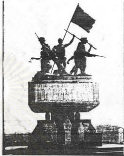
อนุสาวรีย์ราษฎร์ อ.ละหารทราย จ.บุรีรัมย์

ศูนย์วิทยพัชร์พยากร จุฬาลงกรณ์มหาวิทยาลัย