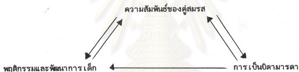
แผนภูมิที่ 1 แบบของความสัมพันธ์ภายในครอบครัว

เบลสกี (Belsky, 1981) ได้ศึกษางานวิจัยที่เกี่ยวข้องต่าง ๆ แล้วสรุปเป็นแบบของความสัมพันธ์ภายในครอบครัว ดังนี้