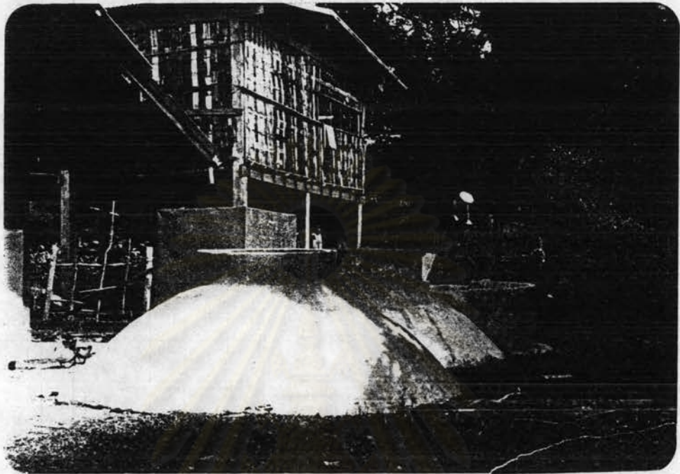
รูปที่ 4.4 เตาแก๊สชีวภาพบริเวณศูนย์โภชนาการเด็กพระราชทาน

ศูนย์วิจัยทรัพยากร จุฬาลงกรณ์มหาวิทยาลัย