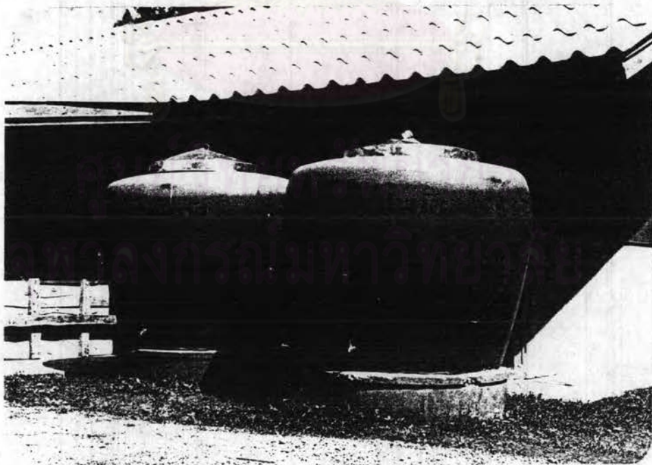
รูปที่ 4.2 โถง 2,000 ลิตร ซึ่งองค์การบริหารส่วนจังหวัดสกลนครมอบให้หมู่บ้านแห่งนี้