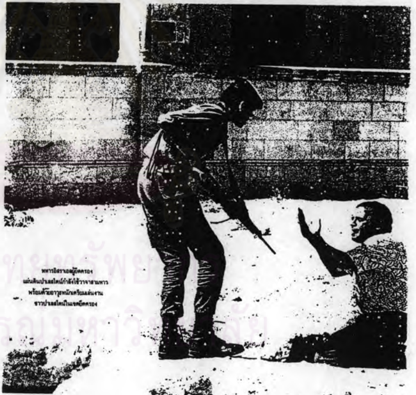
ทหารอิสราเอลผู้ก่อการ แผ่นดินปาเลสไตน์กำลังใช้วางระเบิด หรือหัวธนูอาวุธหนักบนถนน จอร์แดนใกล้เมืองนคร