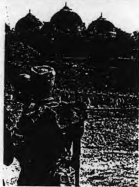
รูปถ่ายจากหนังสือพิมพ์อัลญะฮิร่า มีอยู่ 4 หน้า เป็นฉบับที่ 103 วันที่ 10 ธันวาคม 2533 หน้า 10 บรรทัดที่ 1-4