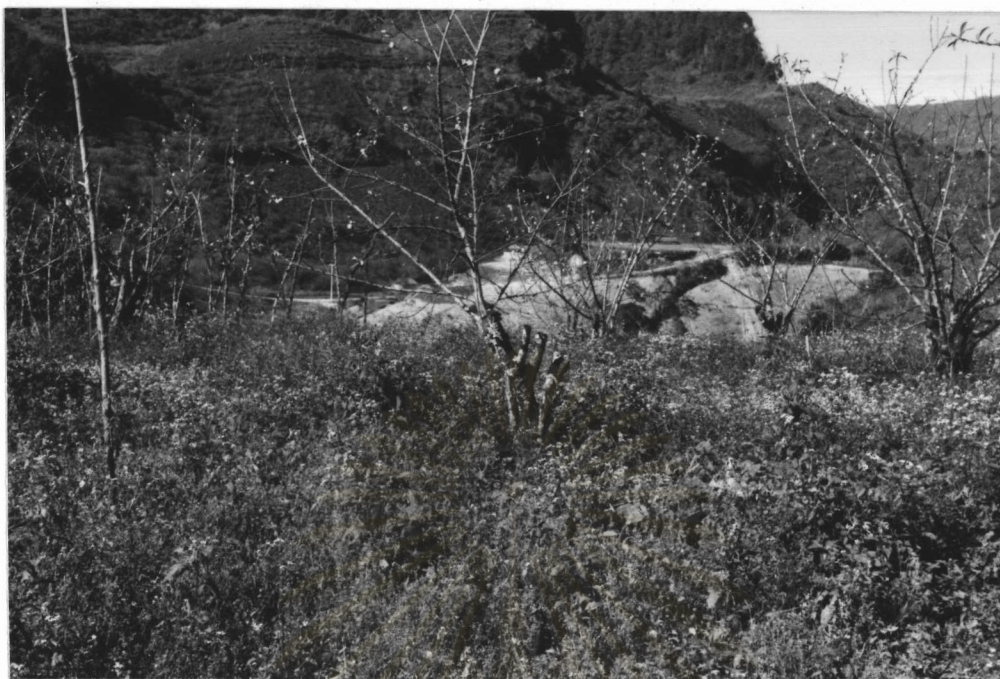
ภาพที่ 3.7 สภาพสวนท้อพันธุ์ซึ่งมีการดูแลรักษาสวนน้อย (ถ่ายเมื่อ 7 กุมภาพันธ์ 2529)