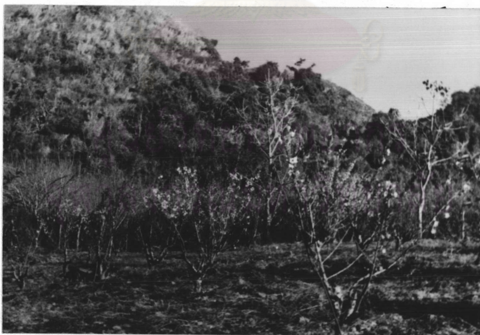
ภาพที่ 3.8 สภาพสวนท้อพันธุ์ซึ่งมีการดูแลรักษาสวนเป็นอย่างดี (ถ่ายเมื่อ 7 กุมภาพันธ์ 2529)