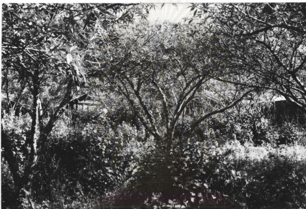
ภาพที่ ๑.๖ สวนท้องถิ่นเมือง (ถ่ายเมื่อ 5 ธันวาคม 2528)