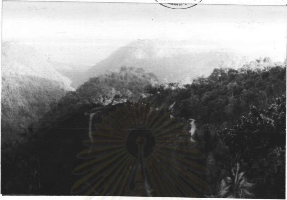
ภาพที่ 3.2 สภาพถนนและทิวทัศน์บนดอยอ่างขาง (ถ่ายเมื่อ 7 กุมภาพันธ์ 2529)