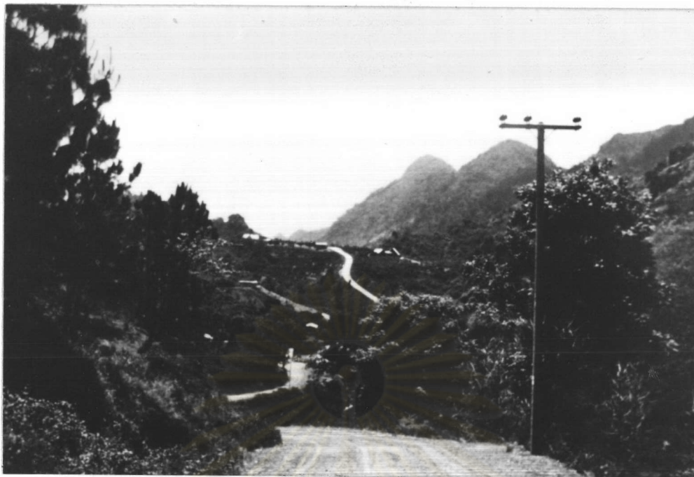
ภาพที่ 3.4 ถนนเข้าหมู่บ้านหลวง (เส้นทางที่สอง ถ่ายเมื่อ 28 เมษายน 2529)