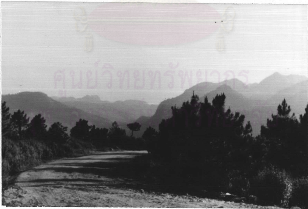
ภาพที่ 3.3 สภาพถนนและทิวทัศน์บนดอยอ่างขาง (ถ่ายเมื่อ 7 กุมภาพันธ์ 2529)