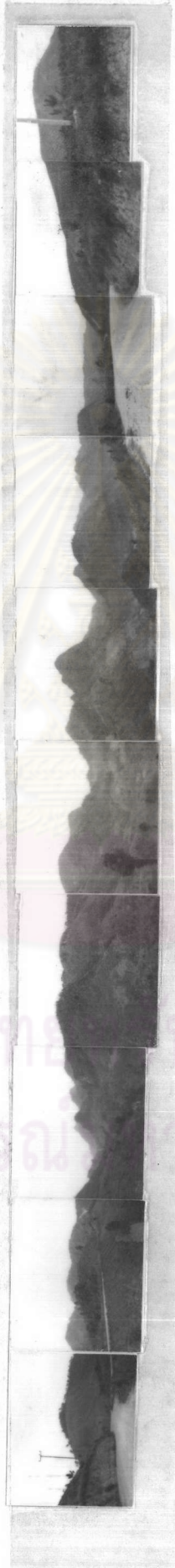
ภาพที่ 3.1 เทือกเขาสูงสลัมซัมซ็อนบนตอยอ่างาง (ถ่ายเมื่อ 28 เมษายน 2529)

ศูนย์วิจัยและพัฒนา จุฬาลงกรณ์มหาวิทยาลัย