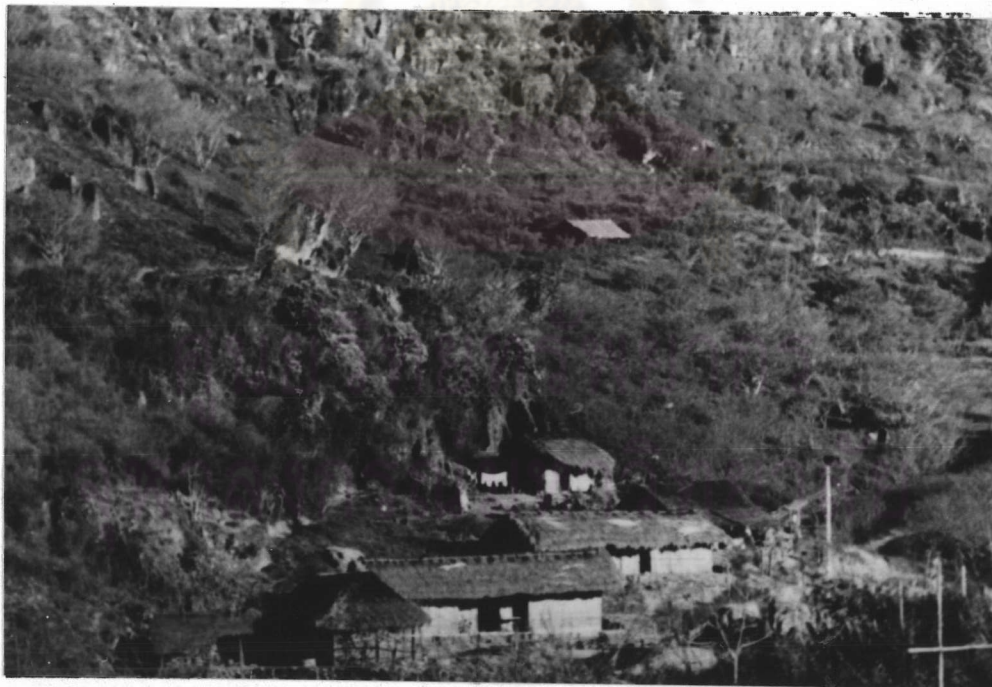
ภาพที่ 3.5 บ้านของเกษตรกรบ้านหลวงที่ปลูกตามเชิงเขาซึ่งมีดินกระจัดกระจาย (ถ่ายเมื่อ 7 กุมภาพันธ์ 2529)