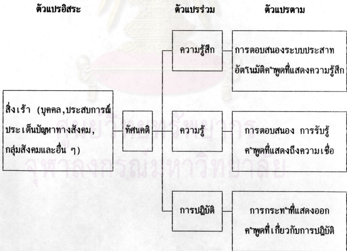
แผนภาพที่ 3 แบบแผนโครงสร้างการรับรู้ของทัศนคติ

ที่มา : Rosenberg, M.J. and Havland, C.I. (อ้างใน Sargent, S. Stansfeld and Williamson, Robert C, 1966 : 270)