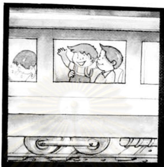
คุณพ่อ และลูกนั่งอยู่บนรถไฟ