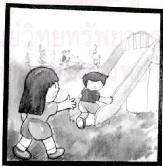
พี่หามองไม่ให้ชนทางที่น้อง