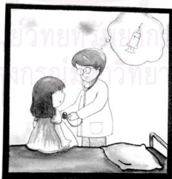
คุณหมอตรวจ