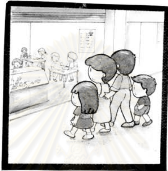
คุณพ่อ คุณแม่ และลูก ๆ เดินไปที่ร้านอาหาร