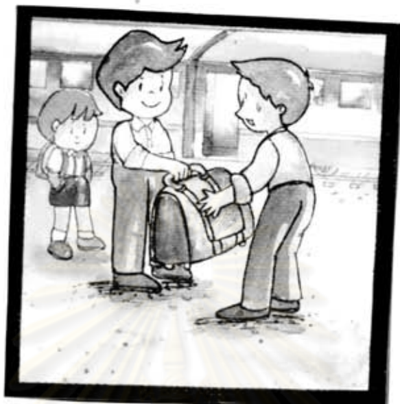
ผู้ชายคนนั้นช่วยเก็บกระเป๋าให้ คุณพ่อ