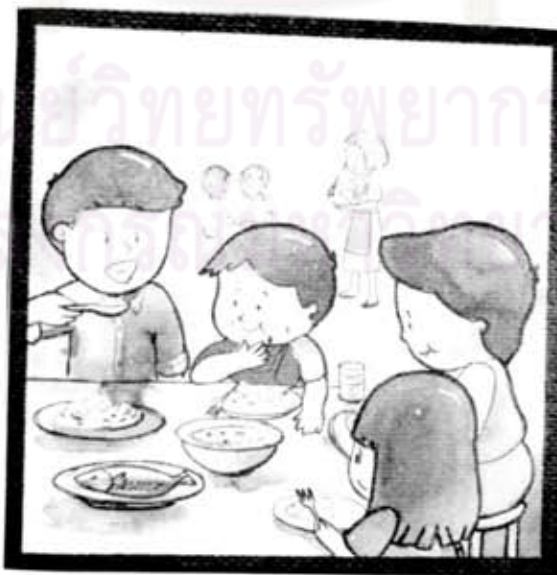
ทุกคนกำลังรับประทานอาหารเช้า