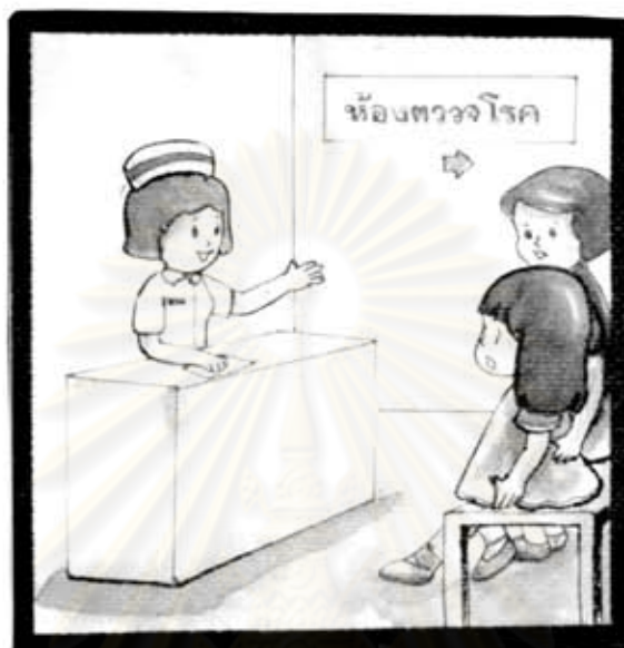
คุณแม่ และลูกนั่งคอยคุณหมอเรียก