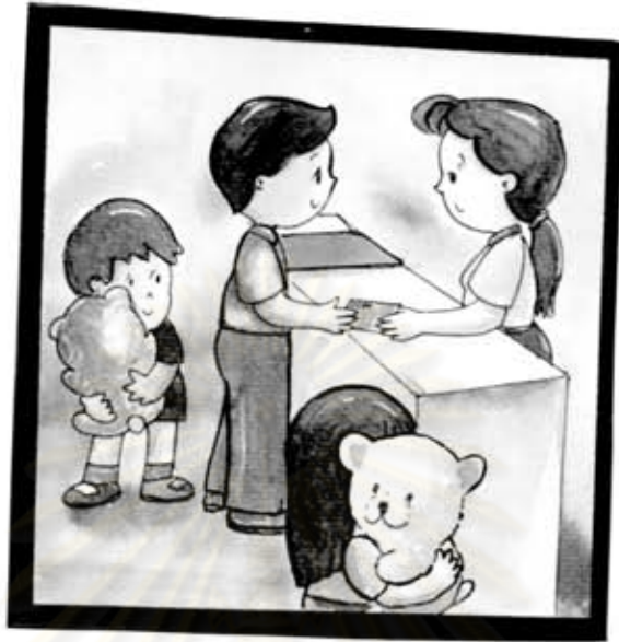
คุณพ่อจ่ายเงิน