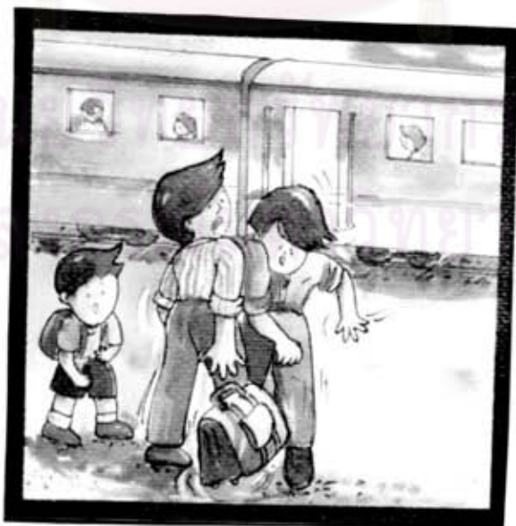
ผู้ชายคนหนึ่ง เดินมา ชนคุณพ่อทำให้กระเป๋าหล่น