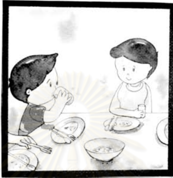
น้องตมหน้า