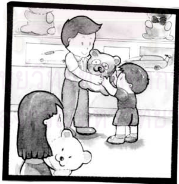
คุณพ่อเอาตุ๊กตาให้น้องอีกตัว