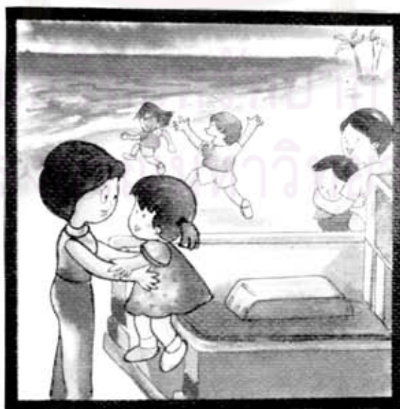
คุณแม่อุ้มลูกลงจากรถ