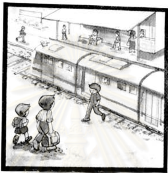
คุณพ่อ และลูก เดินมา ที่รถไฟ