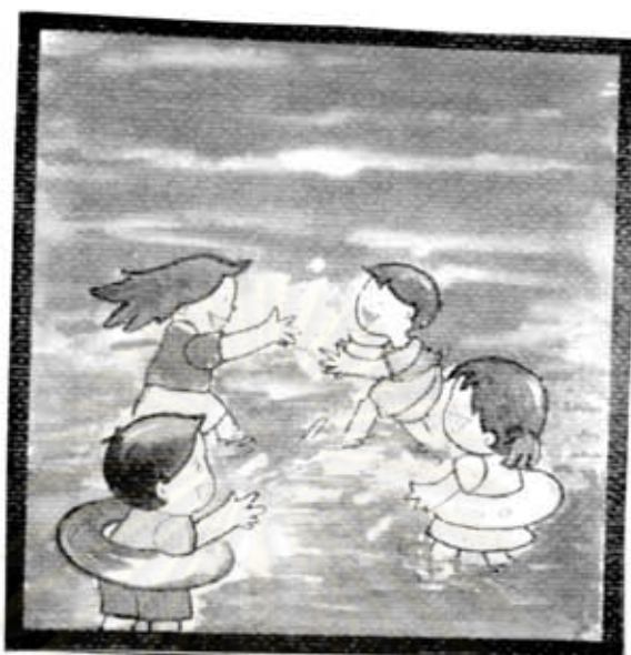
เด็ก ๆ กำลังเล่นน้ำ