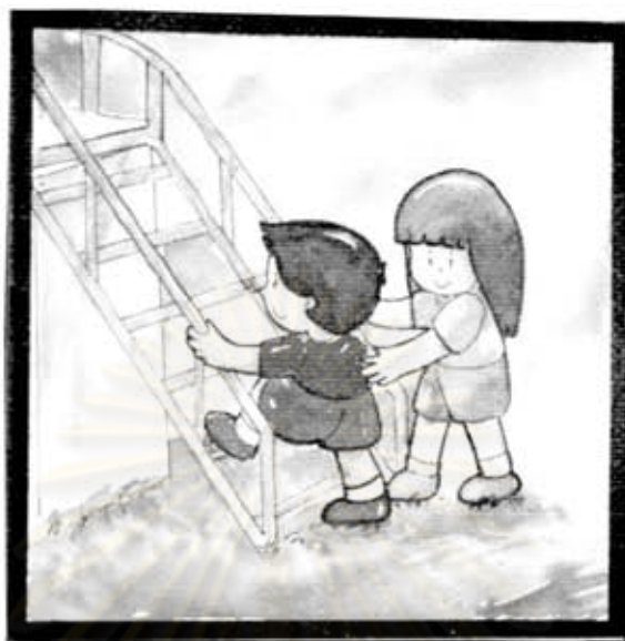
พี่พาน้องขึ้นทางบันได