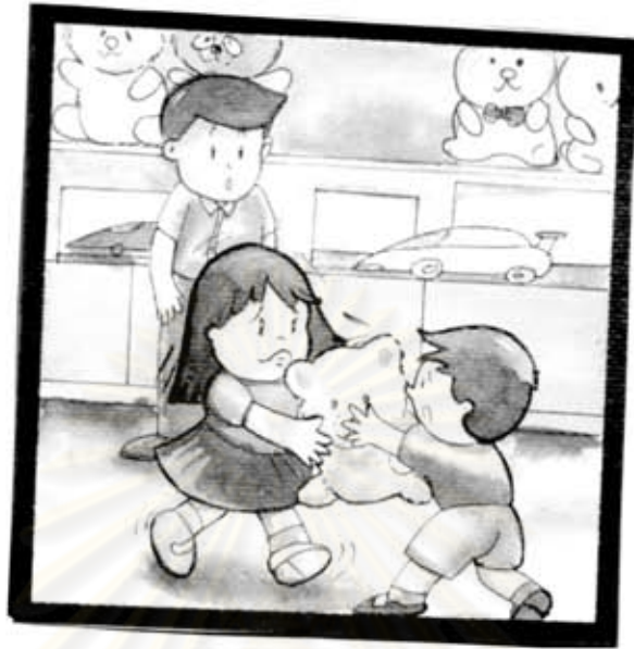
น้องกำลังแย่งตุ๊กตาจากพี่