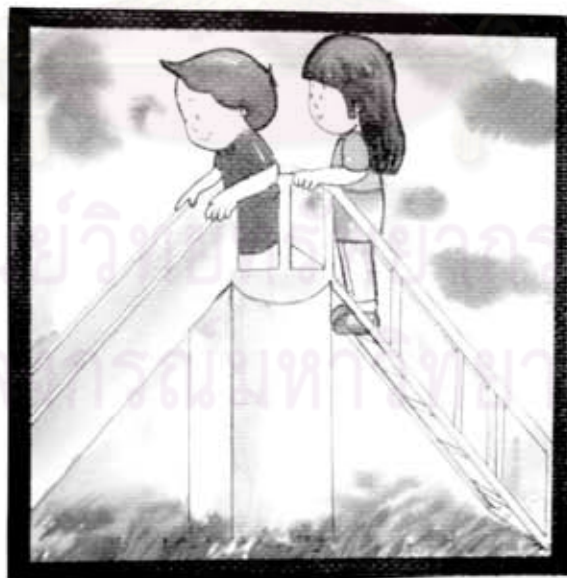
น้องกำลังนั่งบนกระดานเดิน