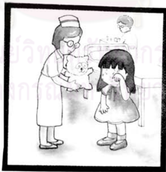
พยาบาลให้ตุ๊กตา