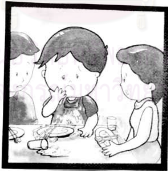
น้องทำน้ำหกใส่เสื้อผ้า