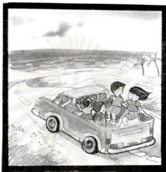
นั่งรถไปเที่ยวทะเล