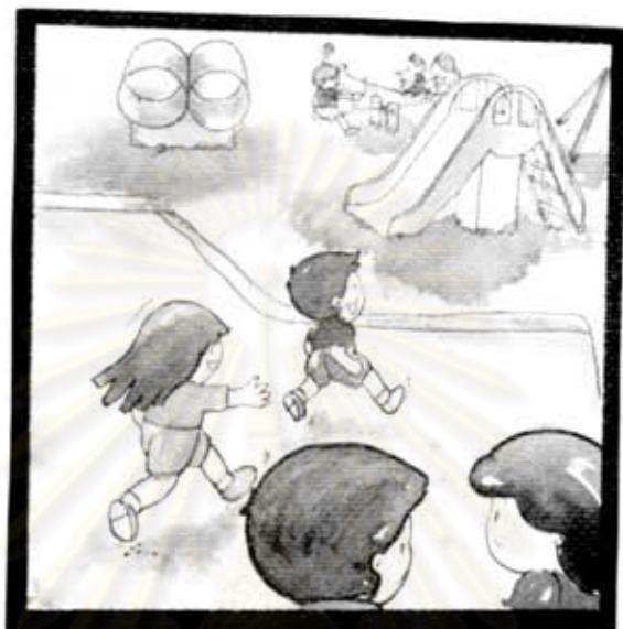
พี่และน้องกำลังวิ่งไปเล่นที่สนามเด็กเล่น