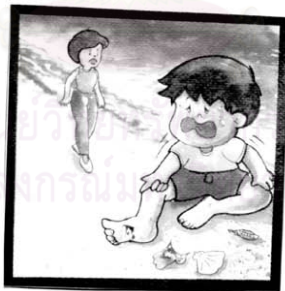
ลูกตกหอยบาดเท้า