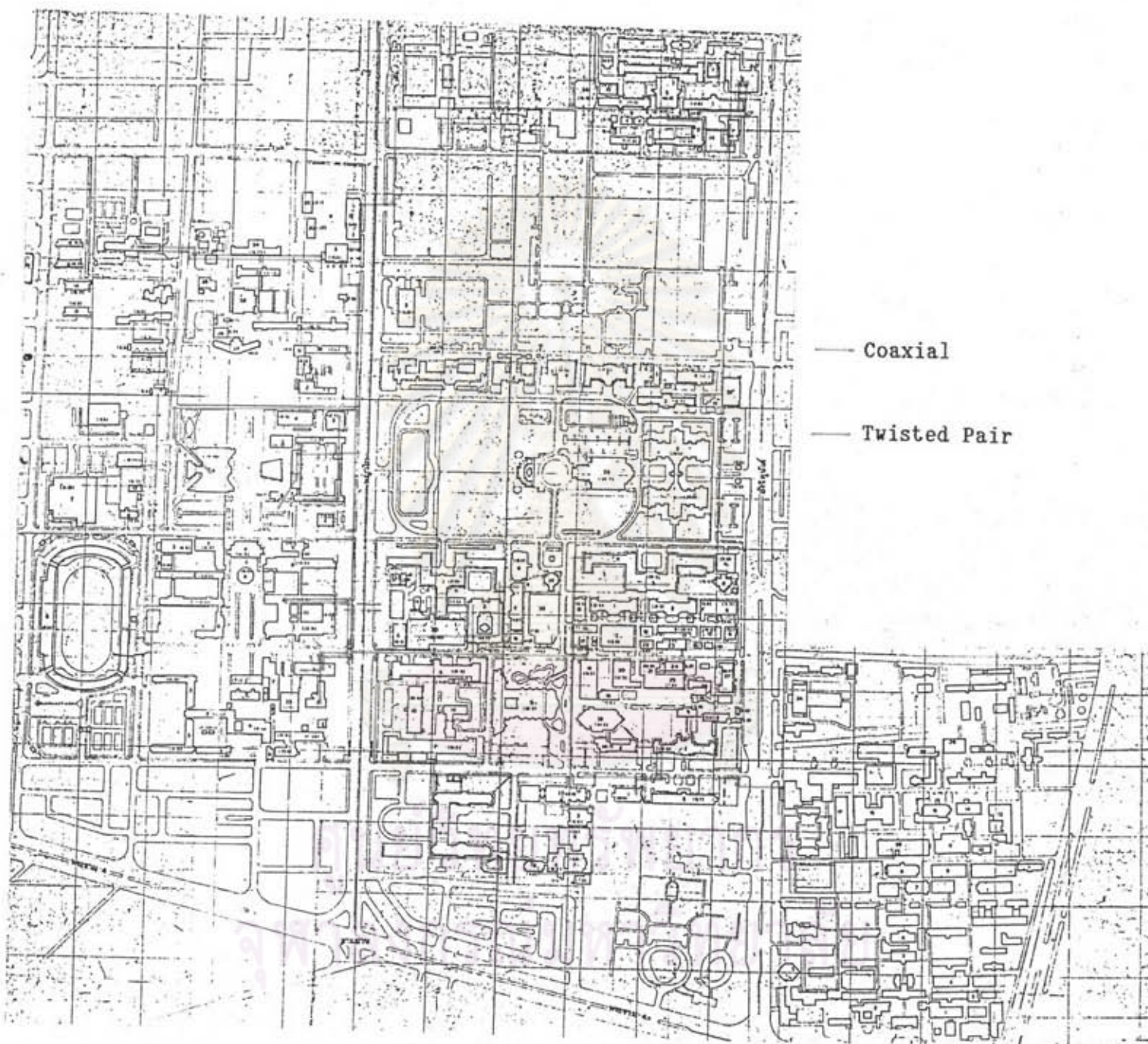
รูป ก.2 แสดงสายเทอร์มินัล 3270 ของ AMDAHL 5860 ที่เดินไปยังส่วนต่างๆของจุฬาลงกรณ์มหาวิทยาลัย