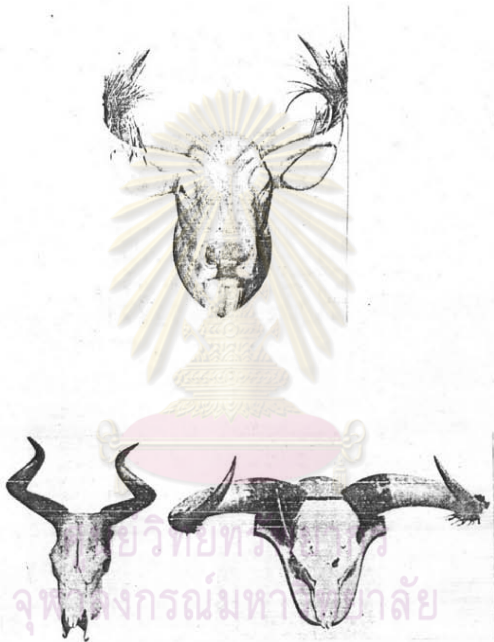
ภาพหมายเลข 1 : แสดงลักษณะของกูปรีหรือโคไพร