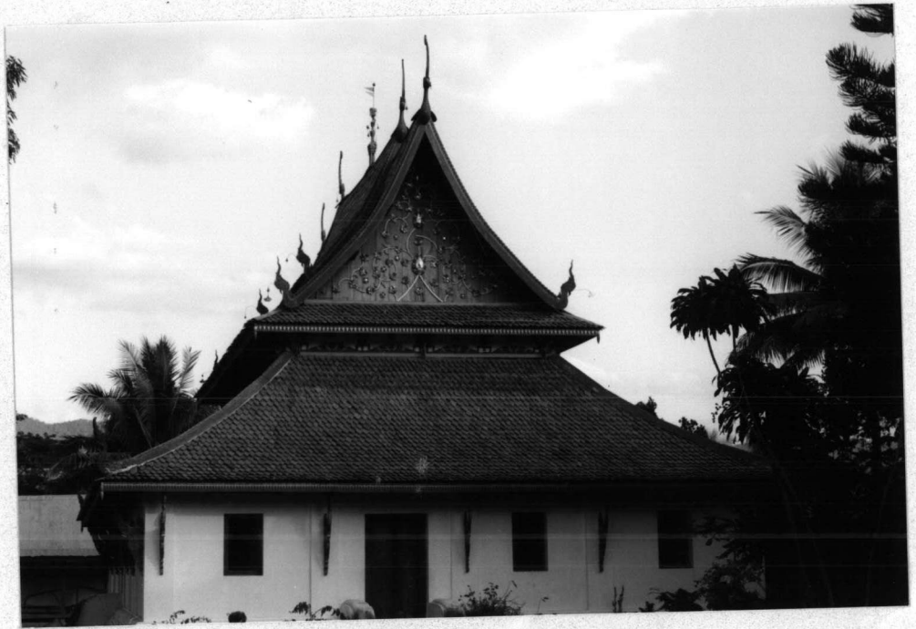
ภาพที่ 4 วิหารตามแบบไทลื้อ (วัดท่าฟ้าใต้)