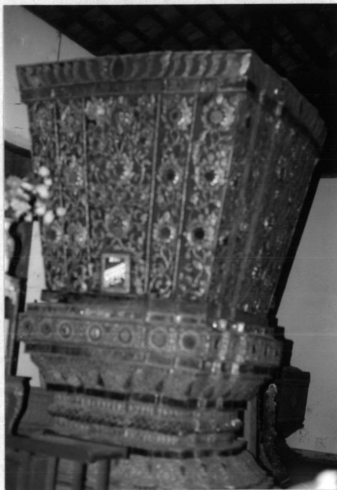
ภาพที่ 3 อรรมาลน์ตามรูปแบบไทลื้อ