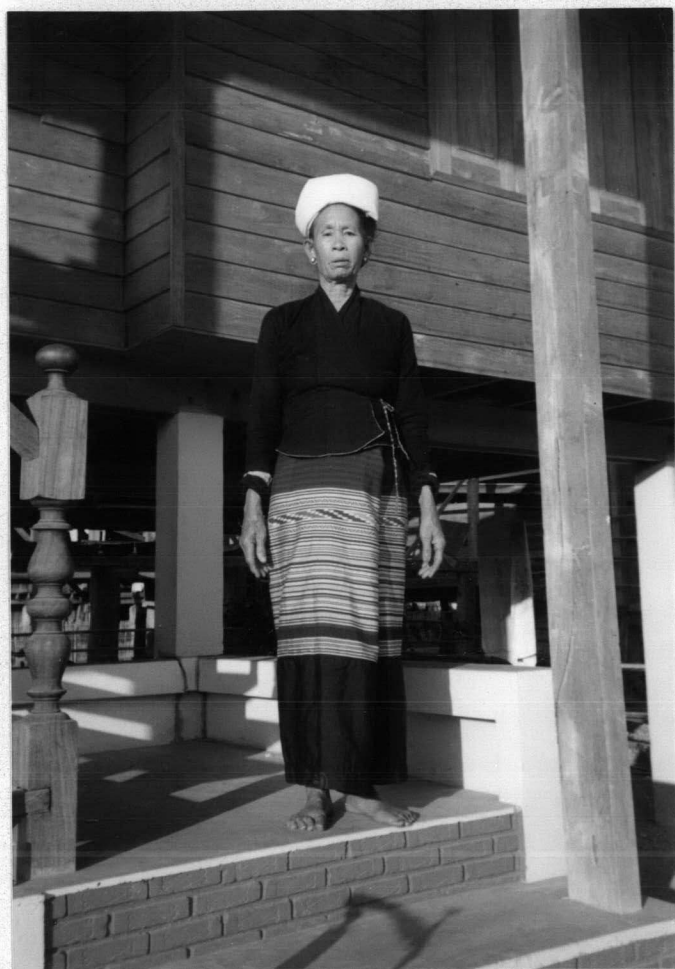
ภาพที่ 1 การแต่งกายของสตรีไทลื้อ