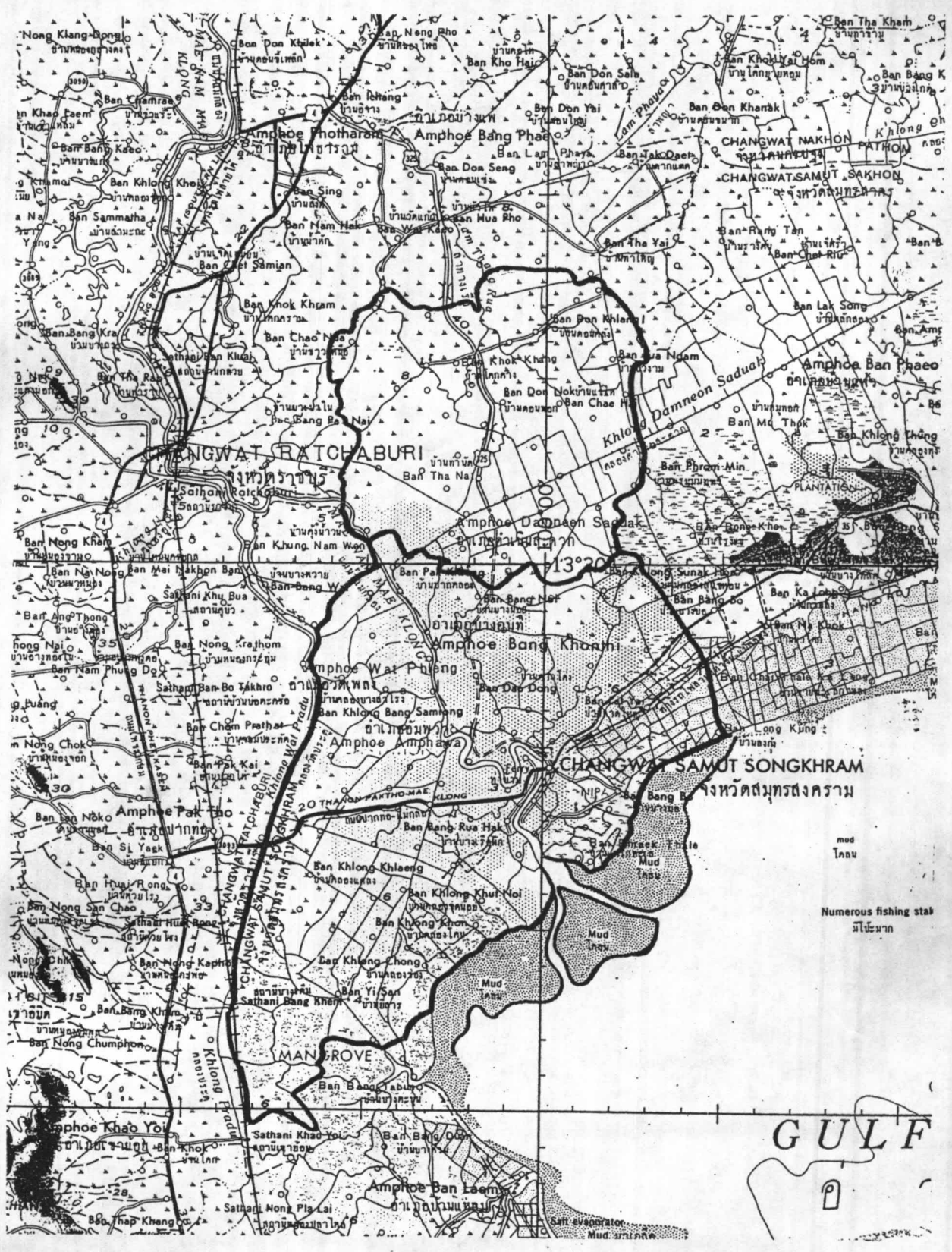
แผนที่ 1.3 แสดงพื้นที่ชุมชนเกษตรที่มีความผูกพันกับแม่น้ำลำคลองในที่ราบลุ่มน้ำแม่กลองตอนล่าง