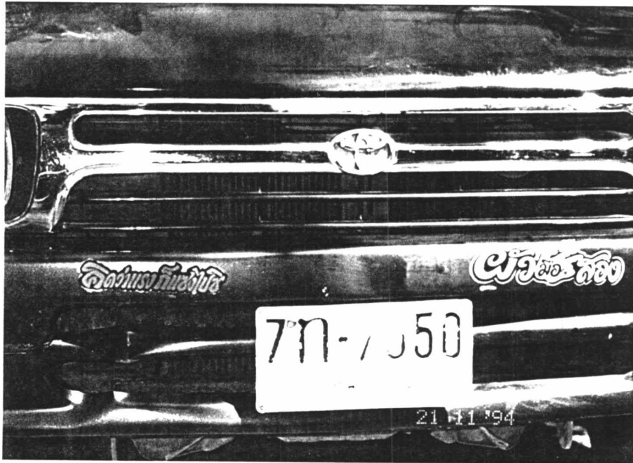
ภาพประกอบที่ 4 ลักษณะการติดสติ๊กเกอร์ที่เป็นไปตามความพอใจของผู้ใช้

ลักษณะการติดโดยทั่วไปนั้นจะนิยมติดไว้ที่กระจกด้านหลังรถตรงช่วงกึ่งกลางด้านล่าง หรือหัวมุมด้านซ้ายและขวาในแนวเฉียงเป็นส่วนใหญ่ แต่ก็ยังมีผู้ส่งสารอีกบางส่วนที่นิยมติดไว้ตรงขอบของฝากระโปรงหลัง บริเวณกันชนหรือในส่วนต่างๆ ที่อยู่นอกเหนือไปจากนี้ โดยการติดข้อความของผู้รับสารแต่ละคนนั้นสามารถเลือกติดที่ละหลายๆ ข้อความในคราวเดียวกันก็ได้ และข้อความดังกล่าวที่นำมาติดนี้ก็ไม่จำเป็นจะต้องมีความเกี่ยวข้อง และสื่อความหมายไปในเรื่องเดียวกันแต่ประการใด