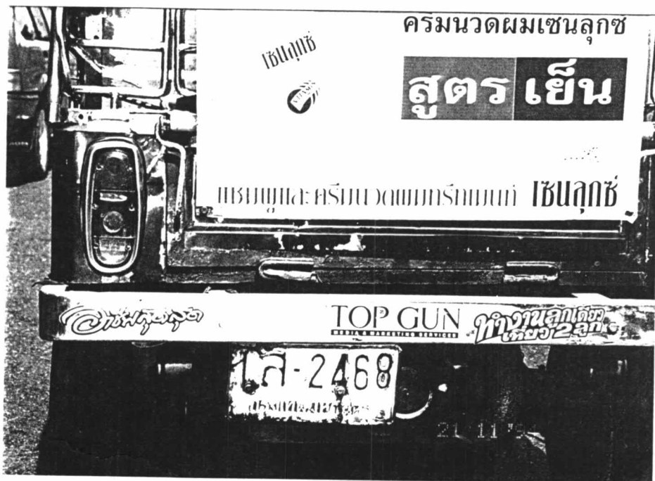
ภาพประกอบที่ 3 สติ๊กเกอร์ประเภทถ้อยคำสำนวนและรถยนต์มักเป็นสิ่งที่สามารถพบเห็นได้คู่กันอยู่เป็นประจำ

ไม่ว่าจะเป็นสติ๊กเกอร์ที่ได้จากการซื้อสำเร็จรูป หรือสั่งตัดก็ตามทั้งสองก็ยังมีวัตถุประสงค์หลักของการใช้คือ การสื่อความหมายของผู้ส่งสารโดยอาศัยสติ๊กเกอร์ ซึ่งเราถือว่าเป็นสื่อขนาดเล็กเป็นสื่อกลางในการสื่อความหมาย และการสื่อความหมายในแต่ละครั้งของสติ๊กเกอร์นั้น จะส่งผลก็ต่อเมื่อตัวมันเองถูกนำไปติดไว้ยังที่แห่งใดแห่งหนึ่ง ซึ่งสำหรับสติ๊กเกอร์ประเภทถ้อยคำสำนวนนั้นเราสามารถจะพบได้ตามสถานที่ชุมชนทั่วไป อาทิเช่น หน้าร้านค้า ป้ายรถโดยสารประจำทาง กำแพงห้องน้ำ หรือแม้แต่ในส่วนบุคคล เช่น อาคารบ้านเรือน เป็นต้น แต่สถานที่ๆ เราจะพบเห็นได้บ่อยครั้งและมากที่สุดก็คือ รถยนต์ประเภทต่างๆ โดยเฉพาะอย่างยิ่งกับรถแท็กซี่ รถสามล้อ รถกระบะ รถสิบล้อรถเมล์ และรถมอเตอร์ไซด์