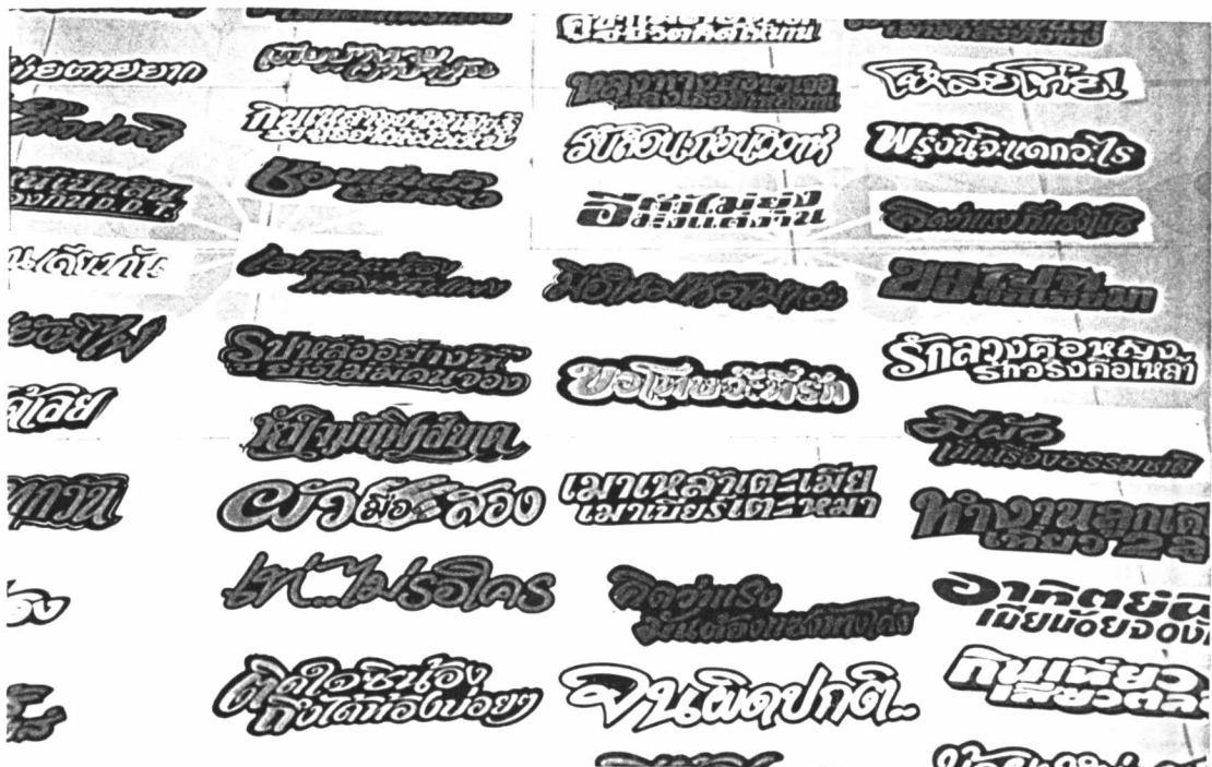
ภาพประกอบที่ 1 ตัวอย่างสติ๊กเกอร์ประเภทถ้อยคำสำนวนแบบขายสำเร็จรูป

ส่วนวัสดุ และ สีสันทของสติ๊กเกอร์ประเภทถ้อยคำสำนวนแบบขายสำเร็จรูปนี้นิยมใช้กระดาษเนื้อมันเงาโดยลงด้วยสีสะท้อนแสงเช่น แดง ชมพู ส้ม เหลือง เขียว หรือม่วง และตัดขอบตัวหนังสือหรือระบายพื้นที่ว่างระหว่างช่องไฟด้วยสีดำอีกครั้งหนึ่ง ซึ่งการใช้สีดังกล่าวนั้น ธานีวัฒน์ งามวิไลลา (สัมภาษณ์ : กรกฎาคม 2537) ได้กล่าวว่าเพื่อต้องการให้ผู้รับสารเห็นข้อความได้ชัดเจนมากยิ่งขึ้นเท่านั้น ส่วนการเลือกให้สีของผู้ผลิตว่า จะให้สีในแต่ละครั้งนั้นไม่มีความเกี่ยวข้องกับเนื้อหาของสติ๊กเกอร์แต่ประการใดเลย แต่จะขึ้นอยู่กับความพึงพอใจของผู้ผลิตมากกว่า