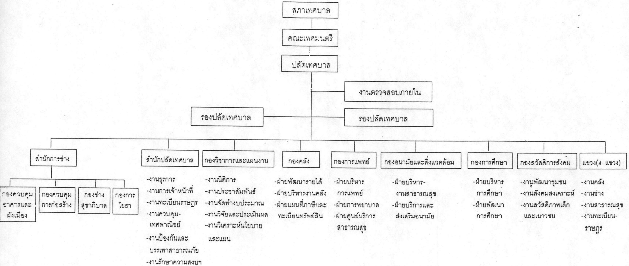
ภาพที่ 2 แสดงโครงสร้างการกำหนดส่วนราชการของเทศบาลนครเชียงใหม่