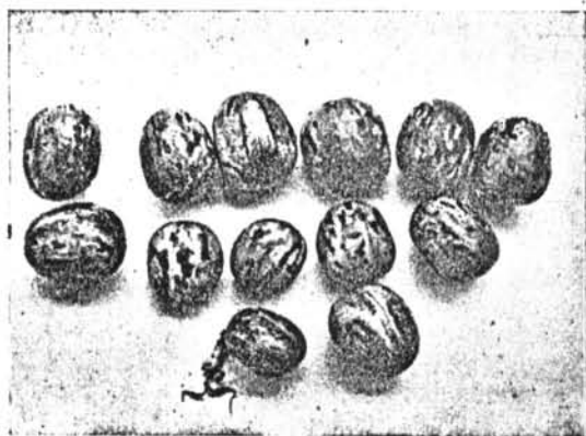
ภาพที่ 1.4 เมล็ดยางพาราพันธุ์ต่างๆ กับเมล็ดทองถั่ว