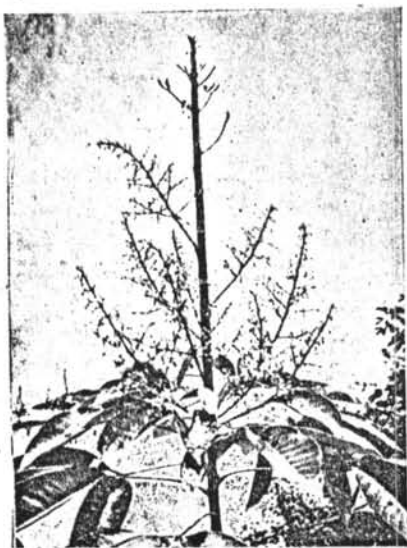
ภาพที่ 1.2 ช่อดอกยางพารา