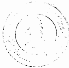
ตารางที่ 9 การเปรียบเทียบความคิดเห็นของนักศึกษาในวิทยาลัยครูพิบูลสงคราม พิษณุโลก ด้านลักษณะกิจกรรมนักศึกษาที่จัดในวิทยาลัย