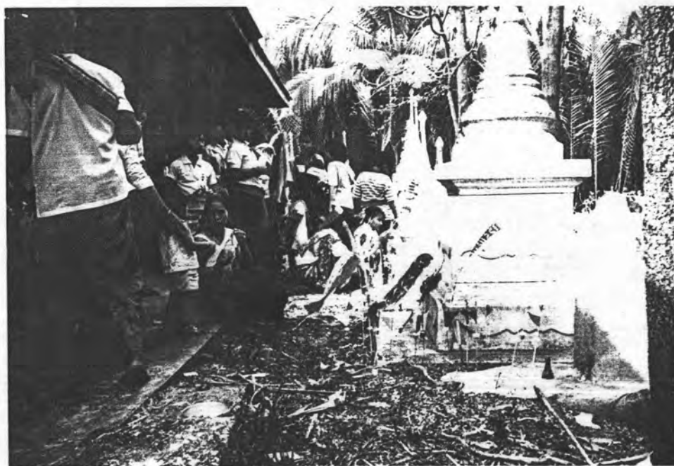
รูปที่ 7 ในวันสงกรานต์(16-18 เมษายน) ชวามอญจะไปไหว้บรรพบุรุษ ผู้ล่วงลับไปแล้วก่อนการสงน้ำพระที่วัด