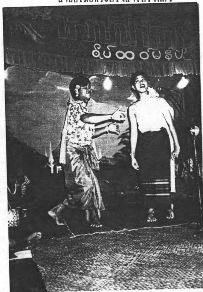
รูปที่ 9 การเล่นทแยมมอญ ของสาวมอญในหมู่บ้าน บางกระดี่ในคืนวัน สงกรานต์