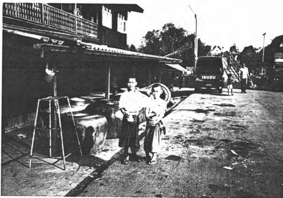
รูปที่ 6 เด็กชวามอญนำกละแม่ไปส่งญาติผู้ใหญ่ที่ถนนับถือก่อนวันสงกรานต์