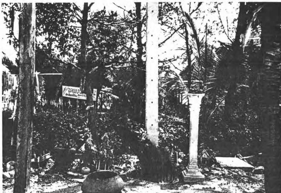
รูปที่ 4 ศาลเจ้าพ่อบางกระดี่ ซึ่งเป็นที่นับถือของชาวบ้านมาก รูปที่ 5 การประกอบพิธีรำผีมอญ เมื่อคนในบ้านเกิดไม่สบาย