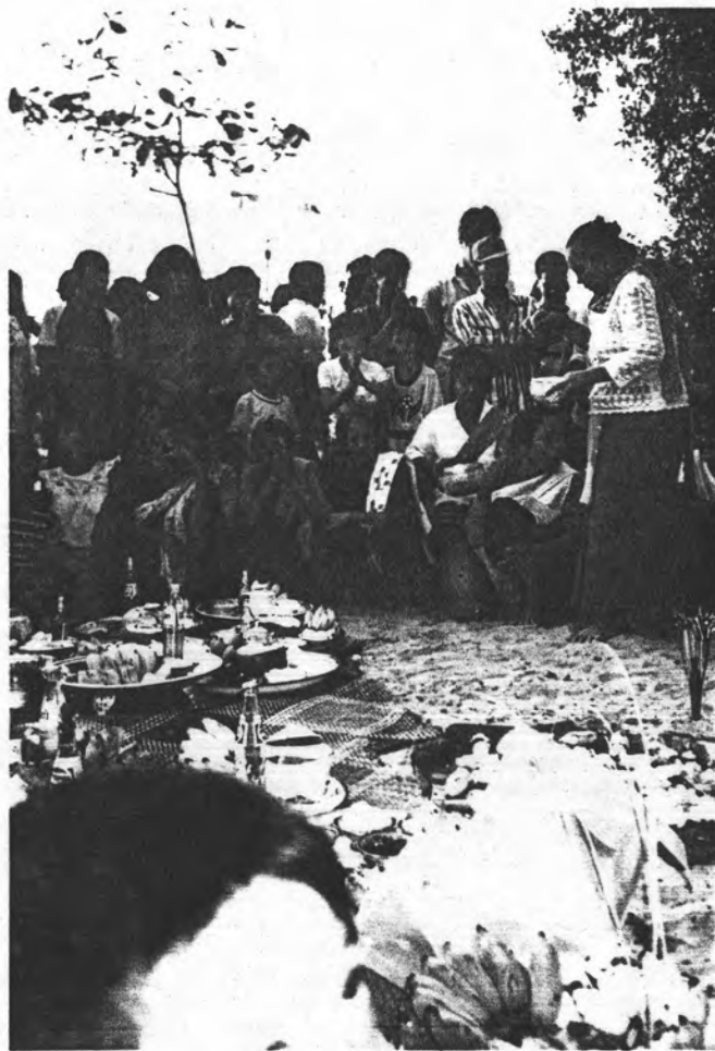
รูปที่ 11 การทำพิธีทรงเจ้า พอบางกระดี่ในวันสุดท้าย ของวันสงกรานต์ ผู้หญิง สูงอายุนุ่งผ้าแดงคือร่างทรง