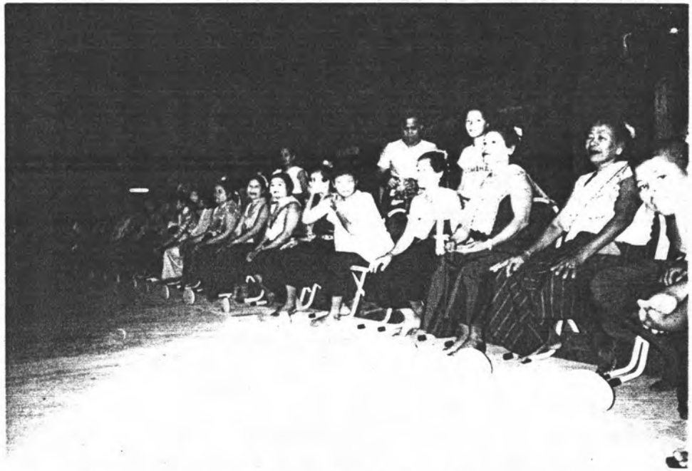
รูปที่ 10 การเล่นเกมสะบ้าของชาวมอญ มักเล่นในเทศกาลสงกรานต์