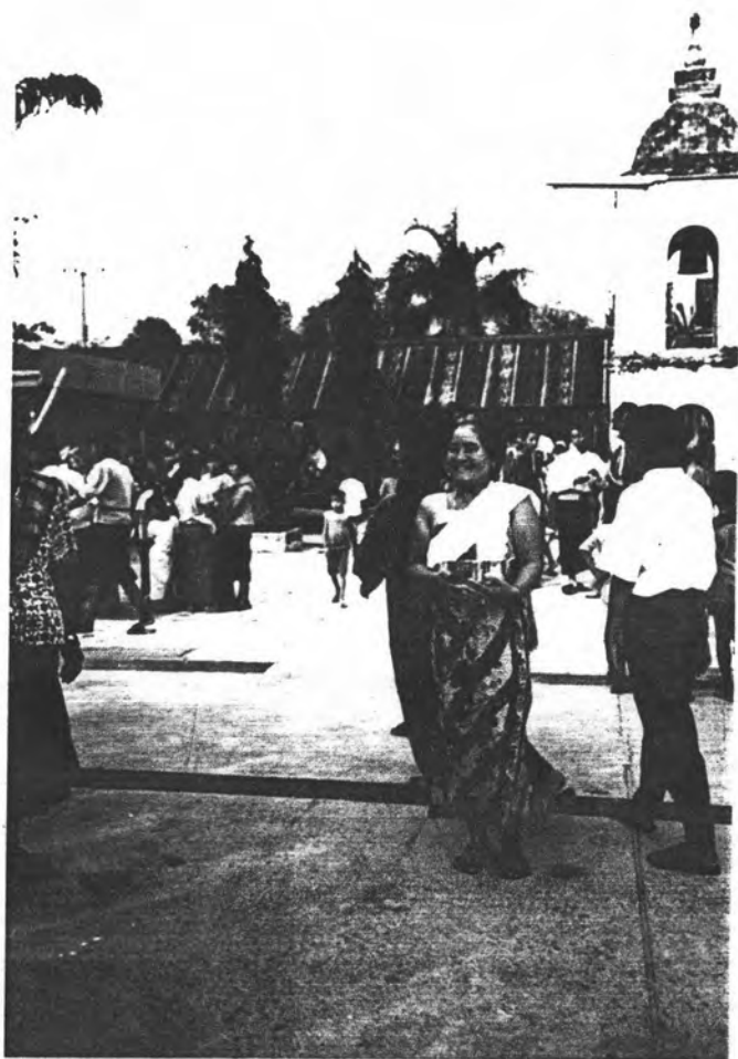
รูปที่ 1-2 การแต่งกายแบบมอญของหญิงสูงอายุ และวัยรุ่นชายชาวมอญ เมื่อมีเทศกาลสำคัญของชาวมอญในหมู่บ้านบางกระดี่