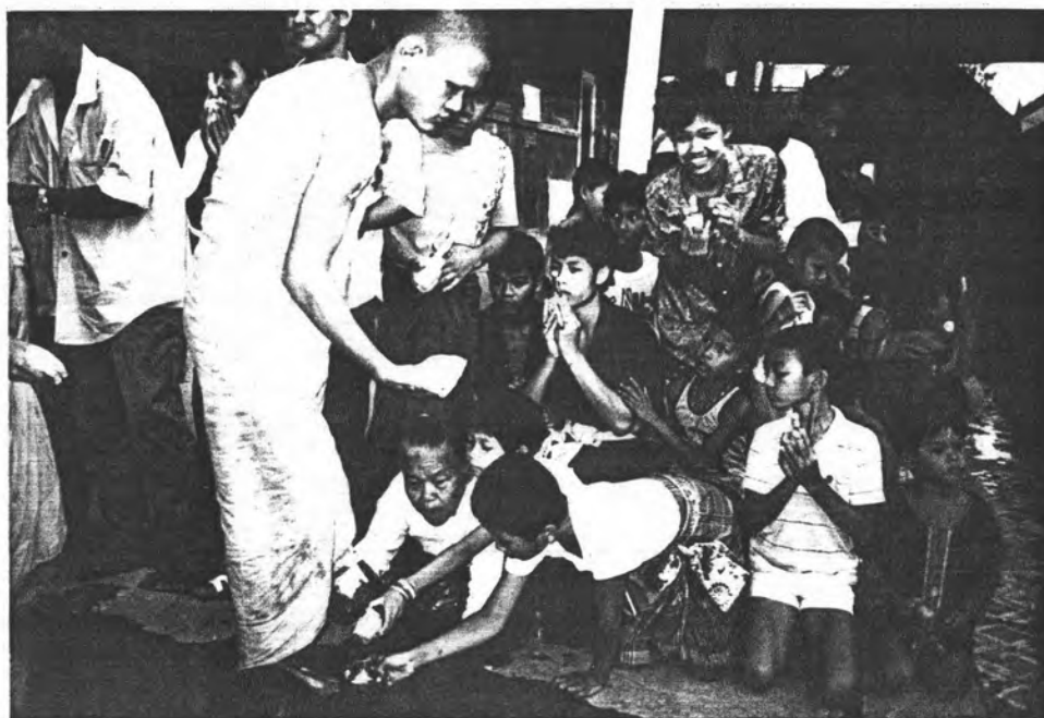
รูปที่ 8 การสร้างพระ ผู้หญิงจะเป็นผู้สร้าง ส่วนผู้ชายจะพรม น้ำอบเมื่อพระสร้างเสร็จแล้ว