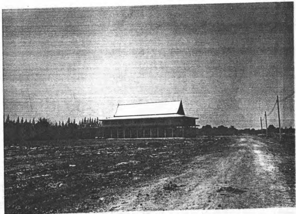
รูปที่ 3 ที่ตั้งสมาคมชาวไทยรามัญ ในหมู่ 2 ซึ่งเป็นของ ชาวมอญทั่วประเทศ

ในด้านกรปกครองชาวบ้านนั้น ไม่ค่อยเป็นปัญหามาก ส่วนใหญ่คดีที่เกิดขึ้น เป็นคดีเล็ก ๆ น้อย ๆ เช่น การทะเลาะวิวาทที่ไม่รุนแรง ซึ่งถ้าไกล่เกลี่ยกันได้ก็ เลิกกันไป แต่ถ้าตกลงกันไม่ได้ก็จะส่งไปให้เจ้าหน้าที่ตำรวจที่สถานีตำรวจท่าข้าม เป็นผู้ตัดสิน ซึ่งส่วนใหญ่เมื่อมีเรื่องจะไม่ค่อยถึงตำรวจ เพราะเมื่อสืบสาวดูก็พบว่า เป็น ญาติ ๆ กัน จึงต้องยอมความกันไป ส่วนปัญหาการลักเล็กขโมยน้อย แม้ชาวบ้านจะ ปลุกบ้านโดยไม่กันรั้ว แต่ไม่ปรากฏว่ามีของหาย เมื่อมีธุระจำเป็นต้องออกนอกบ้าน ก็จะมีคนข้างบ้านช่วยดูแลให้ ปัญหาโจรผู้ร้ายแทบจะไม่มี หรือนาน ๆ มีครั้ง ซึ่ง โจรผู้ร้ายนั้นส่วนใหญ่เป็นคนนอกหมู่บ้าน