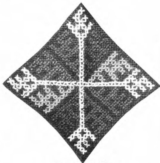
ลายสอง (โฉ่งทิว)