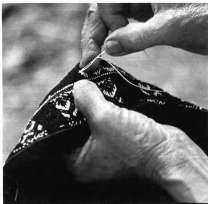
วิธีการจับเข็มและจับผ้าของสตรีเย้า