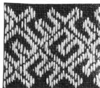
ลายซัด (โฉ่งเกี่ยม)