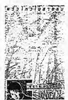
อัลบั้ม พระอิโ ในสายลม