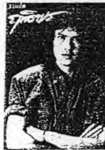
อัลบั้ม รวมฮิต ศิลปิน ดุทธิพร อินสว่าง