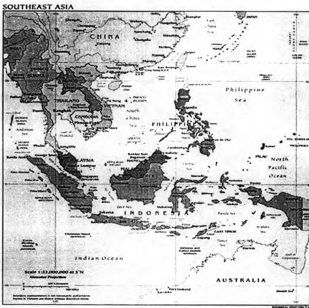
รูปที่ 4 แผนที่ทางภูมิศาสตร์ของประเทศสมาชิกอาเซียน

ภูมิภาคเอเชียตะวันออกเฉียงใต้ซึ่งเป็นที่ตั้งของประเทศสมาชิกอาเซียน ซึ่งประกอบด้วย ประเทศไทย ประเทศลาว ประเทศพม่า ประเทศกัมพูชา ประเทศเวียดนาม ประเทศฟิลิปปินส์ ประเทศอินโดนีเซีย ประเทศสิงคโปร์ ประเทศมาเลเซีย ประเทศบรูไนดารุซซาลาม ถือว่าประสบกับปัญหาการค้ามนุษย์ในระดับวิกฤติ โดยเฉพาะประเทศไทย ประเทศฟิลิปปินส์และประเทศอินโดนีเซีย ที่อยู่ในสถานะของประเทศที่เป็นทั้งต้นทาง ทางผ่าน และประเทศปลายทางในการค้ามนุษย์ ส่วนประเทศมาเลเซีย ประเทศสิงคโปร์และประเทศบรูไน