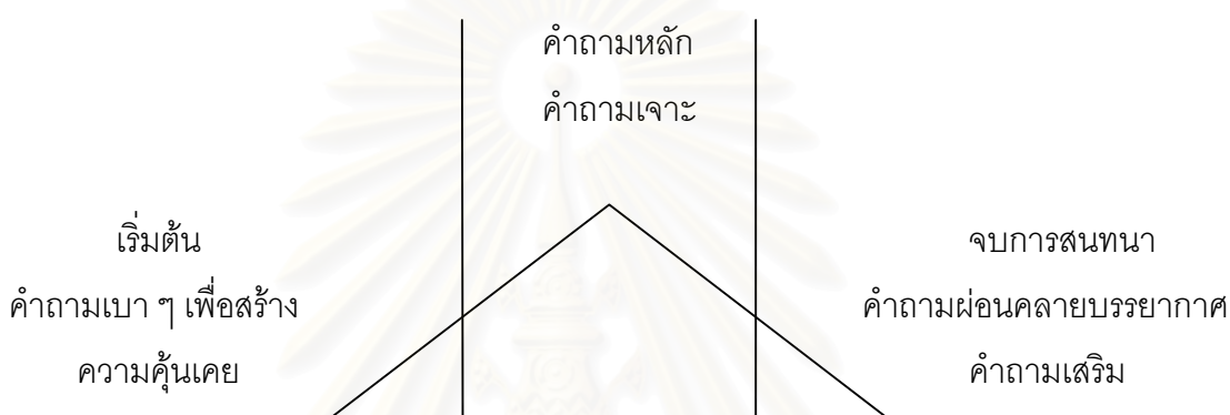
ภาพที่ 1 การสร้างแนวคำถามในการสนทนากลุ่ม (วีรสิทธิ์ สิทธิไตรย์และโยธิน แสงวดี, 2536)

การจัดเรียงแนวคำถามควรจะมีการเรียงคำถามที่เป็นเรื่องทั่ว ๆ ไปที่มีลักษณะง่ายต่อความเข้าใจก่อนเพื่อสร้างบรรยากาศให้คุ้นเคยกันระหว่างนักวิจัยกับผู้เข้าร่วมการสนทนา จากนั้นจึงเข้าสู่คำถามหลักหรือคำถามในประเด็นที่ต้องการศึกษาแล้วจบลงที่คำถามเบา ๆ อีกครั้งหนึ่งเพื่อผ่อนคลายบรรยากาศ ผ่อนคลายความคิดหรือในช่วงท้ายนี้อาจเติมคำถามเสริมเข้าไป อาจเป็นคำถามที่ไม่ได้เตรียมมาก่อน เป็นคำถามที่ปรากฏขึ้นมาระหว่างสนทนา หรือคำถามที่ผู้ดำเนินการสนทนาเห็นว่าถ้าถามก็จะทำให้คำตอบชัดเจนมากขึ้น แต่ไม่ควรเป็นคำตอบที่ยาวเกินไปนัก