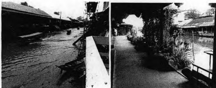
ภาพที่ 4.4: ภาพแสดงอาคารเรือนไม้ริมคลองอัมพวา