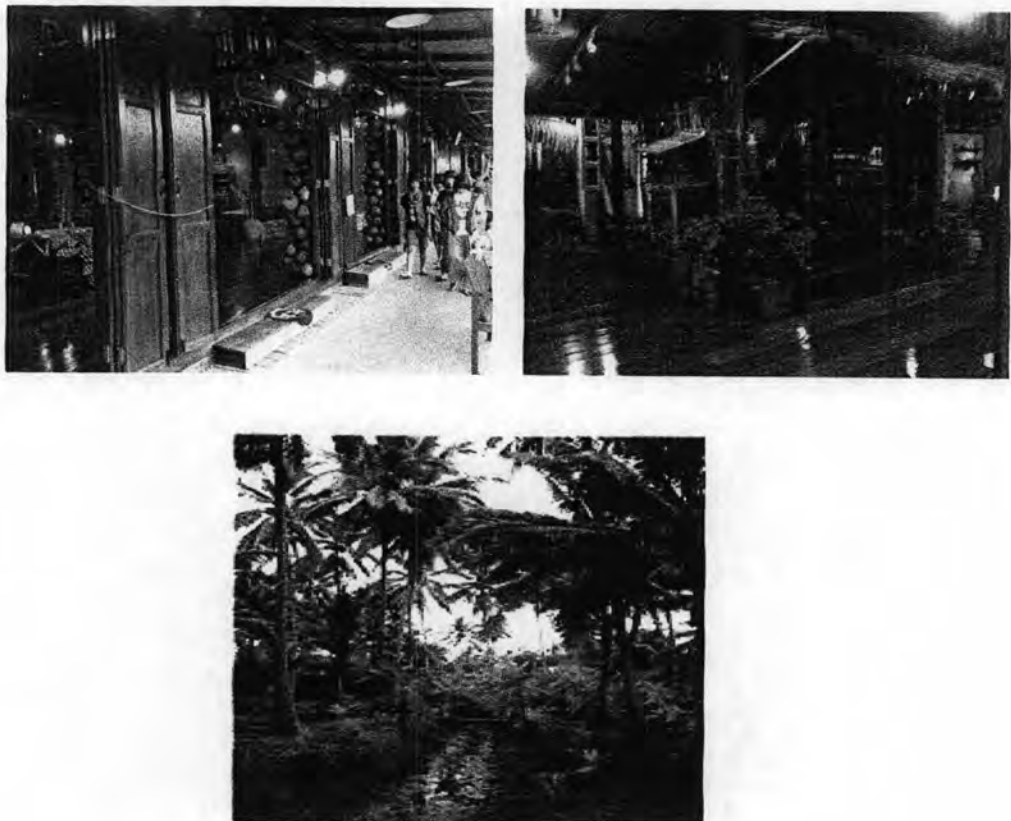
ภาพที่ 4.2: ภาพแสดงส่วนต่างๆ ของโครงการอัมพวา ชัยพัฒนานุรักษ์