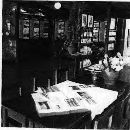
ภาพที่ 4.1: ภาพแสดงส่วนต่างๆ ภายในศูนย์ข้อมูลชุมชนอัมพวา