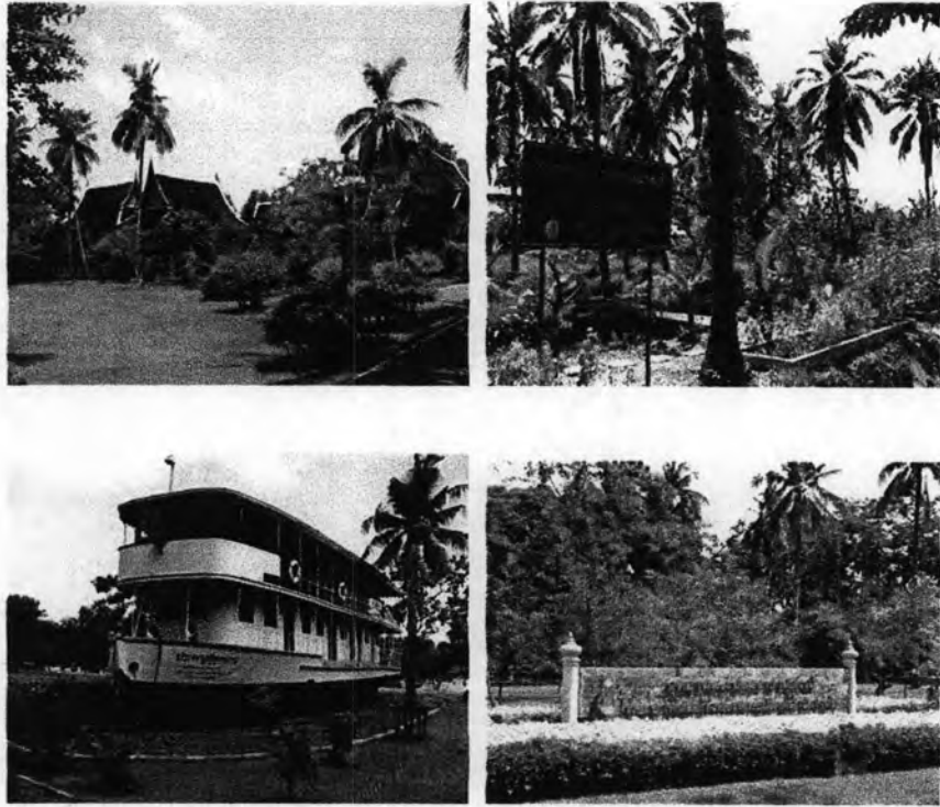
ภาพที่ 4.3: ภาพแสดงส่วนต่างๆ ภายในอุทยาน ร.2