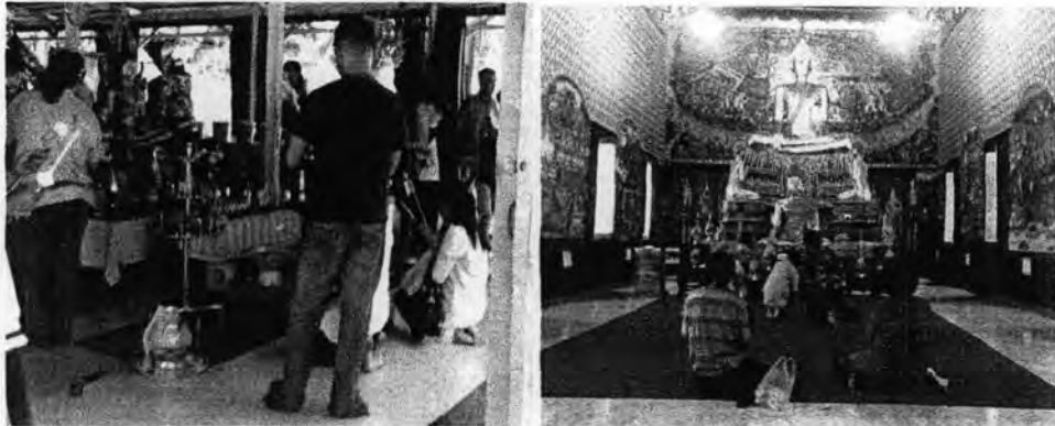
ภาพที่ 4.6: ภาพแสดงกิจกรรมของนักท่องเที่ยวบริเวณวัดอัมพวันเจติยาราม