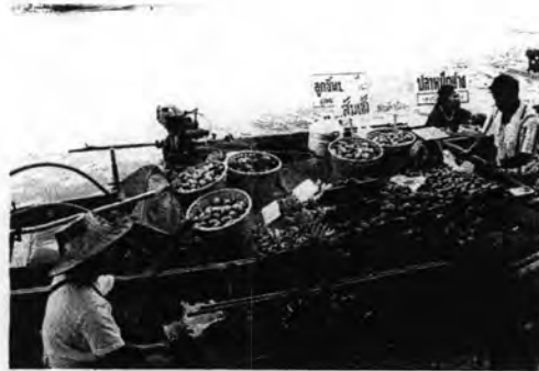
ภาพที่ 4.5: ภาพแสดงบรรยากาศตลาดน้ำยามเย็น