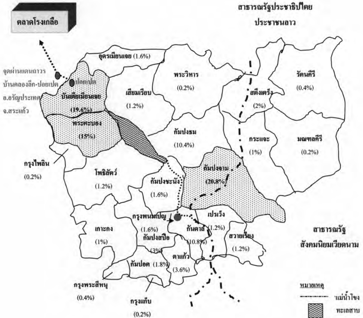
รูปภาพที่ 7.1 แสดงภูมิภานาของกุ่มพ้อค้าชาวกำพูชาที่เดินทางเข้ามาค้าขายในตลาดโรงเกลือ

ที่มา : แผนที่นี้สร้าง โดยผู้วิจัย, 11 มีนาคม พ.ศ. 2550.