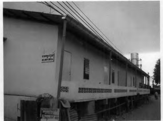
ที่พักอาศัยบริเวณด้านหลังตลาดเคชไทย