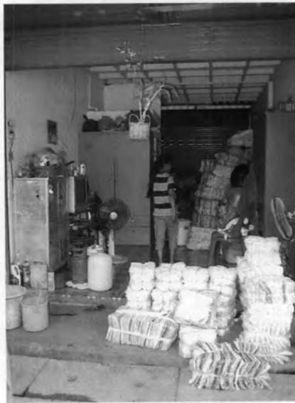
ที่พักอาศัยในตลาดเบญจวรรณ