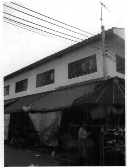
ที่พักอาศัยบริเวณตลาดเคชไทย