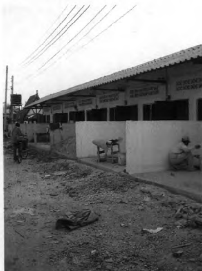
ที่พักอาศัยบริเวณด้านหลังตลาดเคชไทย