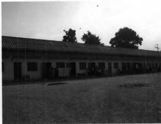
ที่พักอาศัยบริเวณด้านหลังตลาดเคชไทย