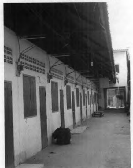
ที่พักอาศัยบริเวณด้านหลังตลาดเคชไทย