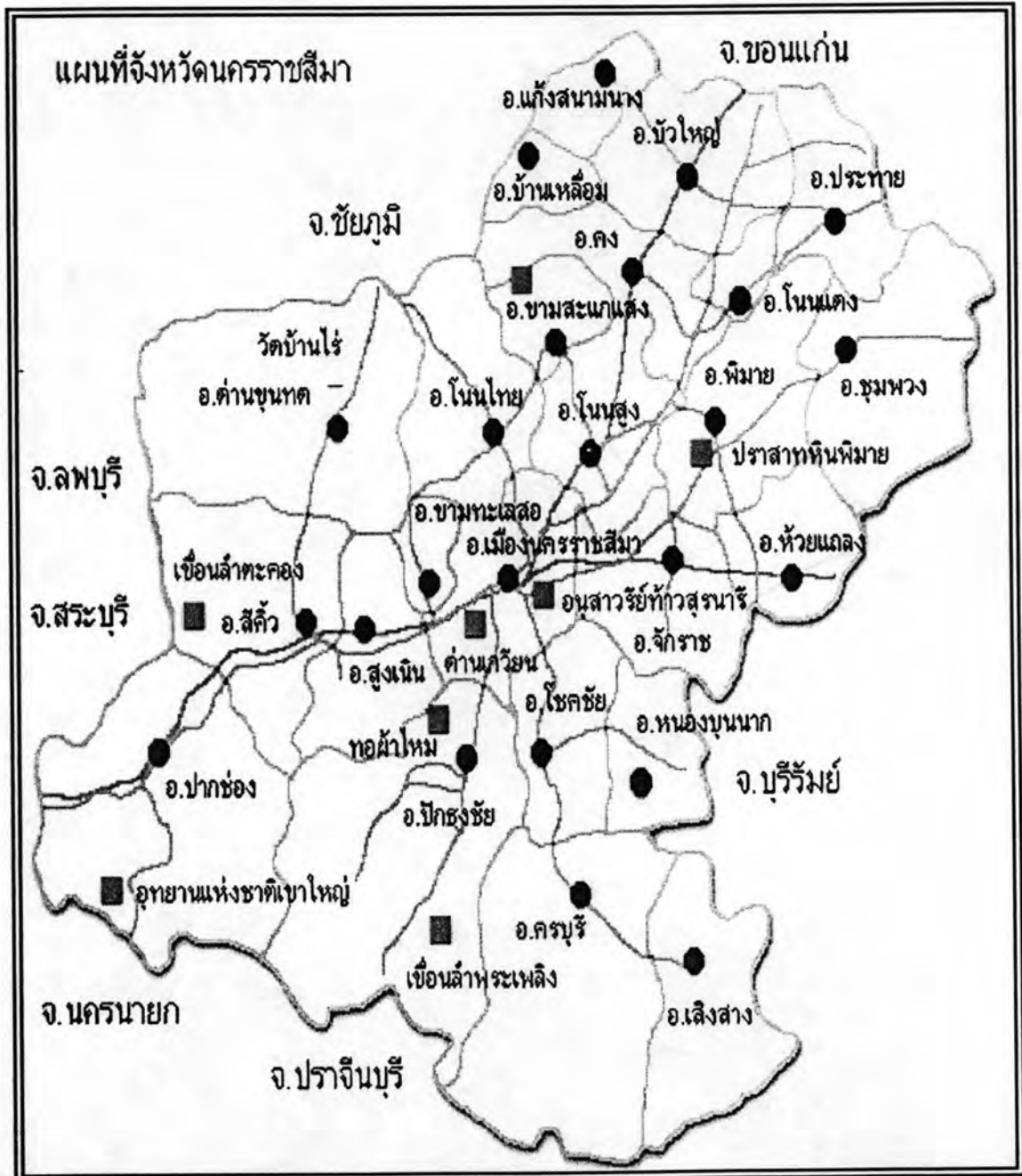
ภาพที่ 1.1 แผนที่จังหวัดนครราชสีมา

ผ่านห้วยแถลง) สุรินทร์ (ผ่านนางรอง-บ้านตะโก) นอกจากนี้ ยังมีรถโดยสารไปยังจังหวัดในภาคอื่นๆ ด้วย ได้แก่ กรุงเทพฯ ชลบุรี พัทธยา ระยอง จันทบุรี ลพบุรี สิงห์บุรี นครสวรรค์ พิษณุโลก เชียงใหม่ และเชียงราย (ไปจนถึงแม่สาย)