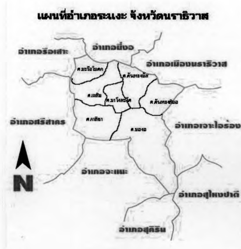
รูปที่ 6 แผนที่อำเภอระแงะ จังหวัดนราธิวาส

อำเภอระแงะแบ่งพื้นที่การปกครองแบ่งออกเป็น 7 ตำบล คือ ต.ตันหยงมัส ต.บาโงสะโต ต.ตันหยงลิมอ ต.มะรือโบตก ต.กาลิซา ต.เฉลิม และต.บองอ