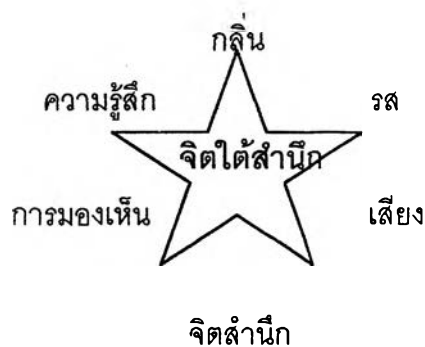
ภาพ : กระบวนการทำงานของจิตใต้สำนึก

จิตใต้สำนึกจะทำการบันทึกและสะสมข้อมูลต่าง ๆ กระตุ้นจากภายนอกผ่านประสาทสัมผัสทั้ง 5 คือ ตา หู จมูก ลิ้น และผิวหนัง โดยเฉพาะการได้เห็นทางตาและการได้ยินทางหู ดังรูป