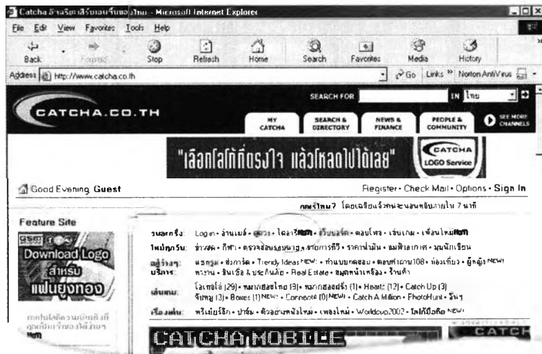
ภาพที่ 3 : หน้า home page ของ catcha.co.th

การวิจัยจะศึกษาลักษณะเกี่ยวกับ ไดอารีออนไลน์โดยจะทำการเก็บข้อมูลจากการสังเกตเว็บไซต์ที่ให้บริการ ไดอารีออนไลน์โดยกำหนดเป็นกลุ่มตัวอย่างจากเว็บไซต์ที่เป็นกรณีศึกษา คือ www.catcha.co.th โดยใช้การสังเกตด้านรูปแบบการใช้งาน ไดอารีออนไลน์และบทบาทที่ ไดอารีออนไลน์มีต่อผู้ใช้งาน โดยจะเก็บข้อมูลจากการขอสัมภาษณ์ในเชิงลึกกับตัวแทนของกลุ่มตัวอย่าง โดยใช้ข้อมูลในการวิจัยตั้งแต่ 1 ธันวาคม 2545 ถึง 31 ธันวาคม 2545