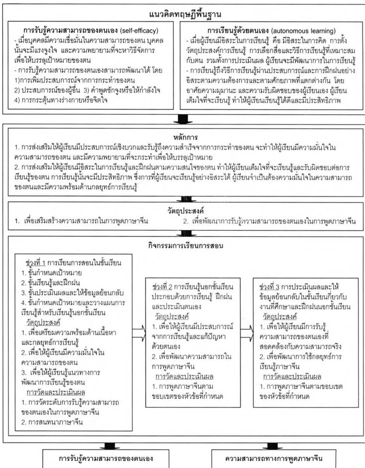
แผนภาพที่ 9 รูปแบบการเรียนการสอนภาษาจีนตามทฤษฎีการรับรู้ความสามารถของตนเองและการเรียนรู้ด้วยตนเอง เพื่อเสริมสร้างความสามารถทางการพูดภาษาจีนของนักศึกษาปริญญาบัณฑิต