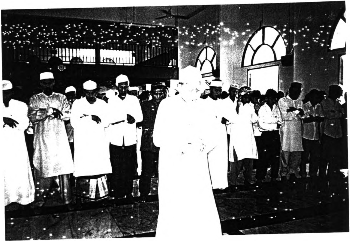
ร่วมละหมาดวันศุกร์

หลังรับฟังคุตบะฮ์วันศุกร์เสร็จ สุภาพบุรุษและสตรีก็ต่างร่วมละหมาดวันศุกร์