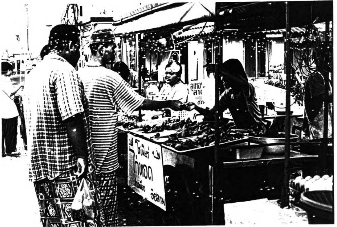
มีคู่แข่งจากต่างถิ่น อาชีพค้าขายของคนในชุมชนอันวาริชนนระห์ ที่เริ่มมีคู่แข่งจากต่างถิ่น มาตั้งร้านเร่ขายในหมู่บ้าน