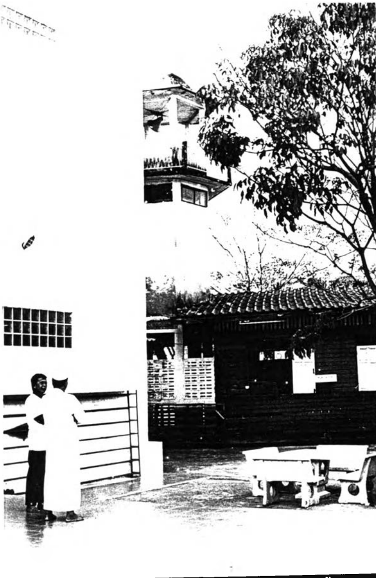
มัสยิดคู่กับโรงเรียน บริเวณโรงเรียนศาสนูปถัมภ์ และมัสยิดอันเป็นอาถนาบริเวณ เดียวกัน เป็นศูนย์กลาง การเรียนรู้ของชุมชน