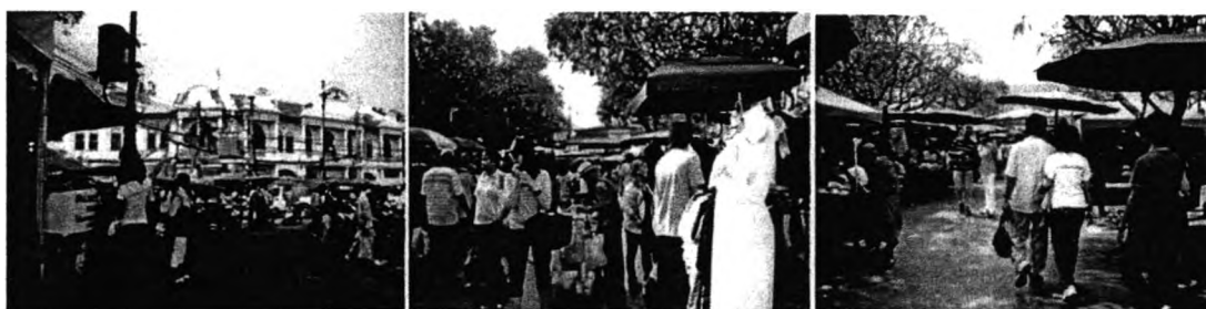
ภาพที่ 1-1 พื้นที่ว่างสาธารณะในพื้นที่กรุงรัตนโกสินทร์

ซึ่งปัจจัยดังกล่าวเป็นปัจจัยสอดคล้องที่ทำให้เกิดความอเนกประโยชน์ในพื้นที่ว่างสาธารณะ เนื่องจากคุณสมบัติดังกล่าวสอดคล้องกับปัจจัยทางสภาพภูมิอากาศ และพฤติกรรมการใช้ชีวิตแบบไทย และนอกจากคุณสมบัติที่สำคัญทางกายภาพ 5 ประการของพื้นที่ว่างสาธารณะที่ดีแบบไทย อาจจะมีปัจจัยอื่นๆ นอกเหนือจากที่กล่าวมา ที่มีความสำคัญในการเกิดพื้นที่ว่างสาธารณะที่ประสบความสำเร็จในพื้นที่ศึกษาดังเช่น ตำแหน่งที่ตั้งของพื้นที่ จุดเปลี่ยนถ่ายการสัญจร เป็นต้น