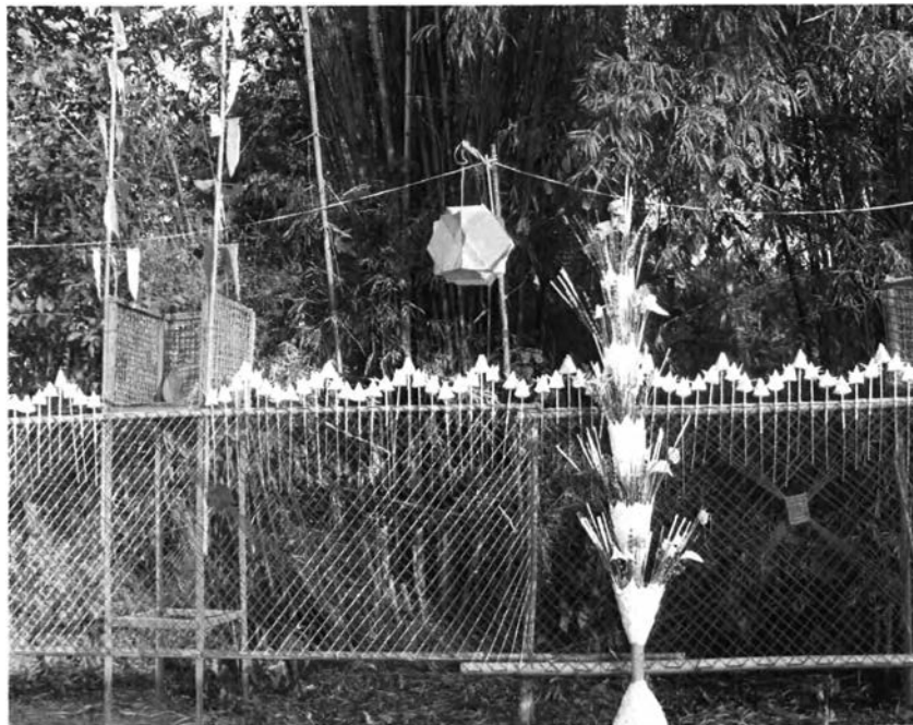
ภาพที่ ๒ : หอบูชาเทวดาที่ชาวบ้านท่าม่วงประดิษฐ์ขึ้น

นอกจาก “หอบูชา” แล้วยังมีการสร้าง “หอบูชาเทวดา” ทั้งหมด ๓๒ หอ ซึ่ง “หอบูชาเทวดา” นี้จะมีลักษณะเป็นหอเล็กๆ สานด้วยไม้ไผ่ทรงสี่เหลี่ยมยกพื้นสูง ด้านหลังจะต้องมีโคมไฟหนึ่งดวงสำหรับให้แสงสว่าง การสร้าง “หอบูชาเทวดา” จะมีลักษณะคล้ายศาลเตี้ยๆ ในวันงานคือวันแรม ๑ ค่ำ เดือนสาม จะต้องนำหม้อดินมาตั้งไว้ ในหม้อดินจะต้องประกอบไปด้วยเครื่องบูชา มีอาหารคาวหวาน น้ำ “หอบูชาเทวดา” ทั้ง ๓๒ หอ นี้ มีความเชื่อว่าเป็นการอัญเชิญเทวดาจากสวรรค์ชั้นดาวดึงส์ซึ่งเป็นบริวารของพระอินทร์ มาปกป้องรักษาสถานที่ และดลบันดาลให้งานบรรลุเป้าหมาย