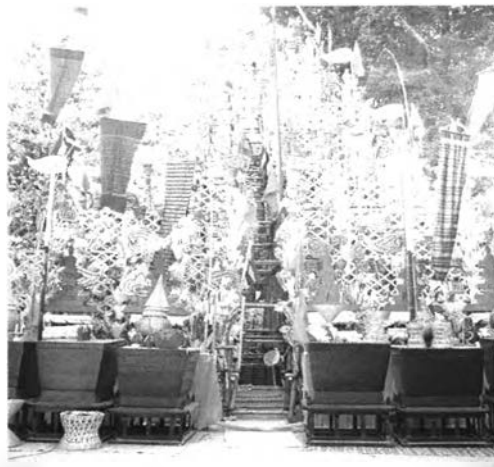
ภาพที่ ๑ : หอบูชาที่ชาวบ้านท่าม่วงประดิษฐ์ขึ้น

ชาวบ้านที่เป็นผู้ชายจะช่วยกันหาไม้ไผ่มาทำ “หอบูชา” ซึ่งมีทั้งหมด ๕ ชั้น แต่ละชั้นแทนพระพุทธรูปของพระพุทธเจ้า ทั้ง ๕ ประการ โครงสร้างของหอบูชาจะต้องทำให้มั่นคงแข็งแรง ฐานชั้นล่างเป็นรูปทรงสี่เหลี่ยมจัตุรัส และทำชั้นต่อๆ มาลดหลั่นกันไป โดยจะมีรูปทรงคล้ายพีระมิด ด้านหน้าของหอบูชาประดับตกแต่งด้วยพานบายศรีขนาดใหญ่ พัดโบก ตุ้ม ธงชาติไทย ตู้พระธรรม และคัมภีร์ไบเบิล ส่วนด้านข้างมีโต๊ะหมู่บูชา และมีกระติบข้าวขนาดใหญ่พร้อมทั้งอุปกรณ์ทางการประมง