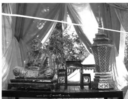
ภาพที่ ๔ : รูปหล่อหลวงปู่ทองมา และอัฐิของหลวงปู่บนนกหัสติลิงค์

เมื่อนกหัสติลิงค์ถูกนำมาเป็นองค์ประกอบหนึ่งของงานบุญแปดหมื่นสี่พันชั้นจะไม่มีพิธีกรรม่านกหัสติลิงค์แต่อย่างใด การสร้างนกหัสติลิงค์ขึ้นมา ก็เพื่อเป็นการรำลึกถึงพระคุณของบูรพาจารย์ คือหลวงปู่ทองมา ถาวโร ซึ่งมรณภาพไปแล้ว ดังนั้นจึงมีการนำรูปหล่อของหลวงปู่ทองมา มาตั้งไว้ และนำอัฐิของหลวงปู่ทองมา มาตั้งไว้บนนกหัสติลิงค์