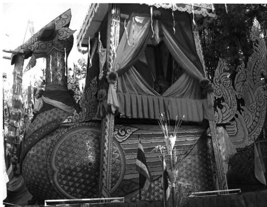
ภาพที่ ๓ : นกหัสติลิงค์ใน “งานบุญเดือนสาม”

เมื่อนกหัสติลิงค์ถูกนำมาเป็นองค์ประกอบหนึ่งของงานบุญแปดหมื่นสี่พันชั้นจะไม่มีพิธีกรรม่านกหัสติลิงค์แต่อย่างใด การสร้างนกหัสติลิงค์ขึ้นมา ก็เพื่อเป็นการรำลึกถึงพระคุณของบูรพาจารย์ คือหลวงปู่ทองมา ถาวโร ซึ่งมรณภาพไปแล้ว ดังนั้นจึงมีการนำรูปหล่อของหลวงปู่ทองมา มาตั้งไว้ และนำอัฐิของหลวงปู่ทองมา มาตั้งไว้บนนกหัสติลิงค์