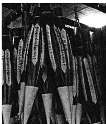
ภาพที่ ๖ : “พระมงคลยอดแก้วดวงธรรม” เครื่องประกอบพิธีที่ประดิษฐ์ขึ้นใหม่

“พระมงคลยอดแก้วดวงธรรม” เป็นเครื่องประกอบพิธีอีกอย่างหนึ่งที่ประดิษฐ์ขึ้นใหม่ โดยชาวบ้านจะช่วยกันหาดอกไม้ให้ครบตามจำนวน อย่างละหนึ่งหมื่นดอก นำดอกไม้ไปตากแห้ง บด เป็นผงให้ละเอียด นำผงดอกไม้แต่ละชนิดไปใส่ในกรวยกระดาษ หุ้มด้วยหญ้าคา นำคาถาที่เขียนด้วย คิ้วอักษรธรรมอีสานติดไว้ด้านข้าง ดังภาพ