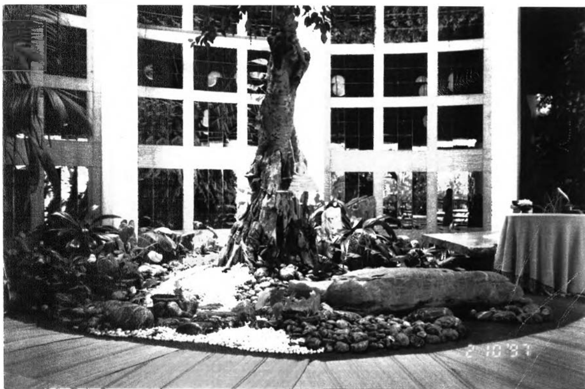
‘จริงมศ’กาลา’