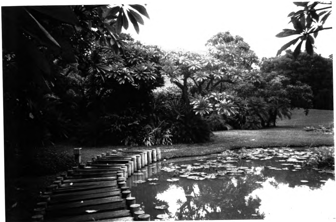
'สะพานแห่งสติ'