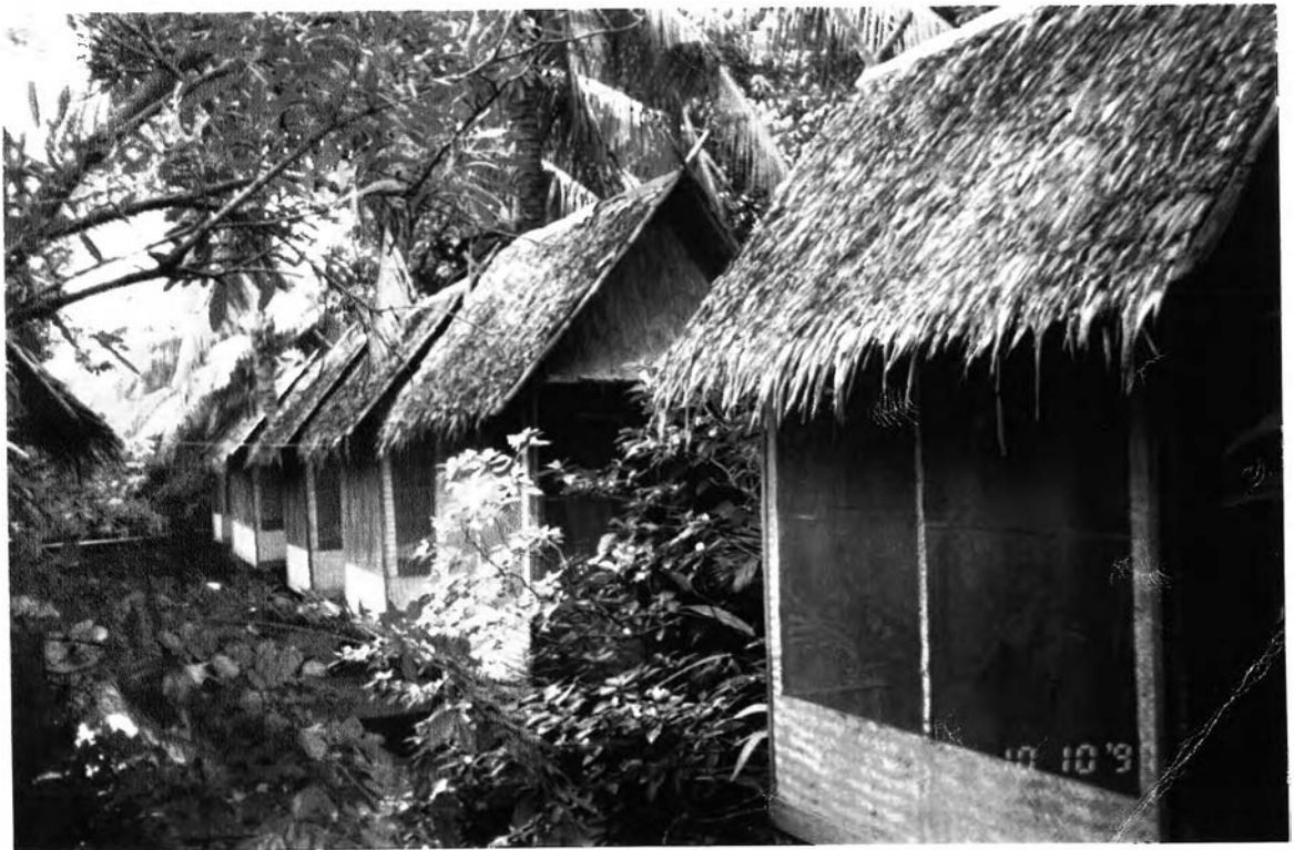
ที่พักสำหรับผู้เข้าชมปฏิบัติธรรม ในโครงการของสถานปฏิบัติธรรมเสถียรธรรมสถาน