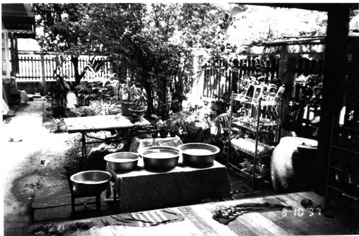
มุมที่จัดขึ้น สำหรับให้เด็กทุกคนได้เรียนรู้ ในกิจวัตรเหลือตนเองโดยการล้างแก้วนม