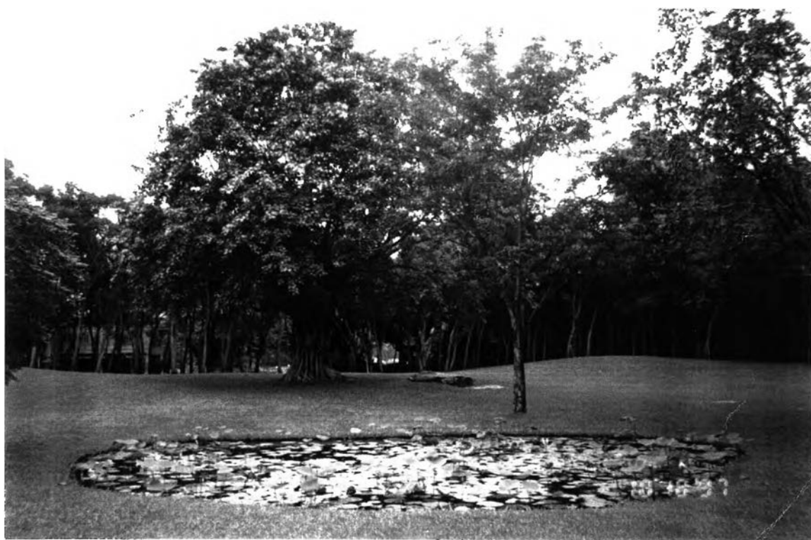
ความร่มรื่น ในสถานปฏิบัติธรรมเสถียรธรรมสถาน