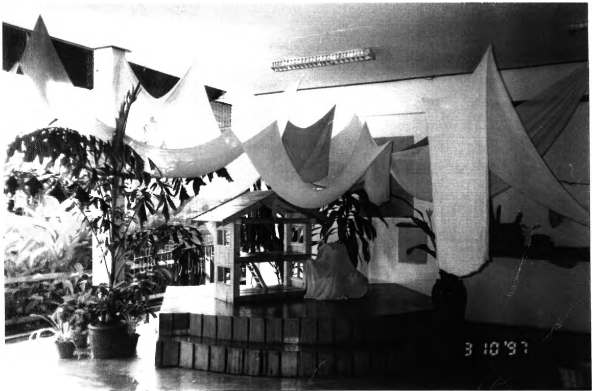
ภายในบริเวณ ศูนย์พัฒนาเด็กก่อนเกณฑ์วัดศิรินทรชัยารามนิมิต