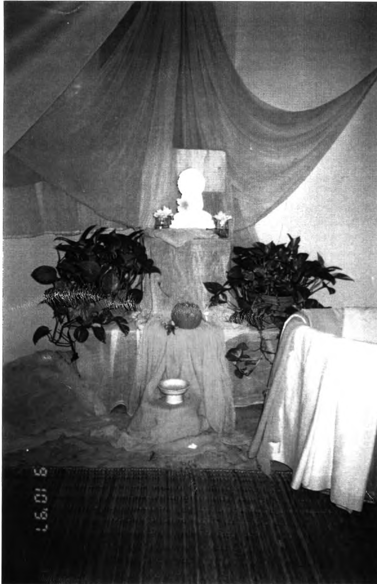
พระพุทธรูป ประจำทุกห้องเจียน