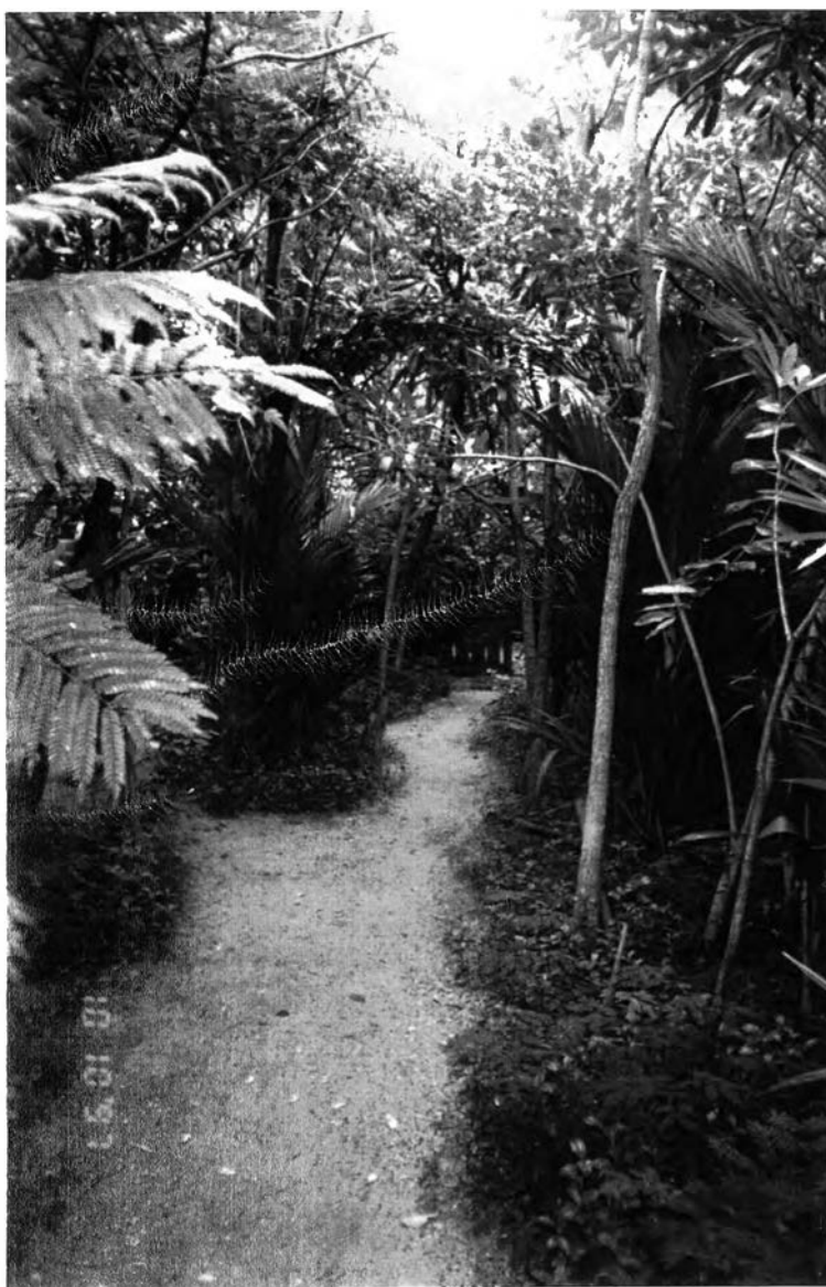
บริเวณทางเดิน