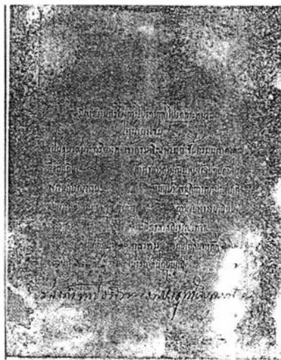
ภาพที่ 2 ใบสัญญาบัตร “ขุนเสนาะดุริยางค์”

พระยาเสนาะฯ เข้ารับราชการในกระทรวงวัง สมัยรัชกาลที่ 5 เมื่อปี พ.ศ. 2422 มีหน้าที่บรรเลงเพลงปี่พาทย์ในพระราชทานพิธีต่าง ๆ ซึ่งตอนนั้นอายุเพียง 13 ปี คนที่รับราชการเป็นนักดนตรีหลวงสมัยนั้นจะเรียกกันว่า ประจํากรมพิณพาทย์หลวง ซึ่งบางครั้งต้องไปช่วยราชการกรมมหรสพด้วย ต่อมาได้รับพระราชทานบรรดาศักดิ์เป็น “ขุนเสนาะดุริยางค์” เมื่อวันที่ 10 ตุลาคม พ.ศ. 2446 ในตำแหน่งเจ้ากรมพิณพาทย์หลวง เมื่ออายุได้ 37 ปี