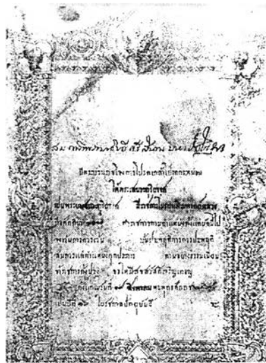
ภาพที่ 5 ใบสัญญาบัตร “พระยาเสนาะดุริยางค์”

ด้วยความซื่อตรงต่อหน้าที่ราชการ มีความจงรักภักดีในพระมหากษัตริย์และความสามารถ ในดุริยางคศิลป์เป็นที่ยิ่ง ท่านจึงได้รับราชทานบรรดาศักดิ์ เป็น “พระยาเสนาะดุริยางค์” เมื่อวันที่ 19 สิงหาคม พ.ศ. 2476