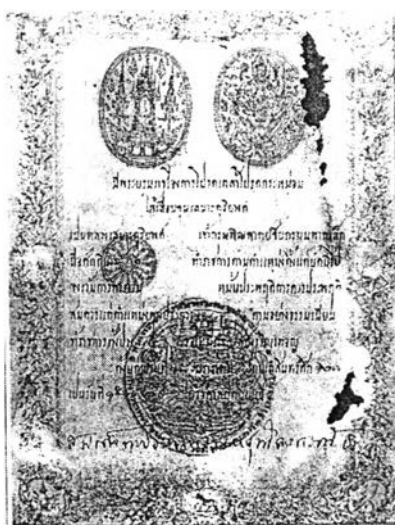
ภาพที่ 3 ใบสัญญาบัตร “หลวงเสนาะดุริยางค์”

ครั้งถึงปลายรัชกาลที่ 5 ตรงกับวันที่ 18 มกราคม พ.ศ. 2453 พระบาทสมเด็จพระจุลจอมเกล้าเจ้าอยู่หัว ได้ทรงพระกรุณาโปรดเกล้าเลื่อนยศเป็น “หลวงเสนาะดุริยางค์” ในตำแหน่ง เจ้ากรมพิณพาทยหลวง