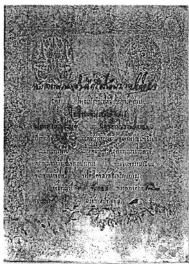
ภาพที่ 4 ใบสัญญาบัตร “พระเสนาะดุริยางค์”

ครั้นถึงสมัยพระบาทสมเด็จพระมงกุฎเกล้าเจ้าอยู่หัว ท่านก็ได้รับพระราชทานยศเป็น “พระเสนาะดุริยางค์” รับราชการในกรมมหรสพ และได้รับพระราชทานเหรียญคุณวุฒิมาลาเข็มศิลปวิทยา