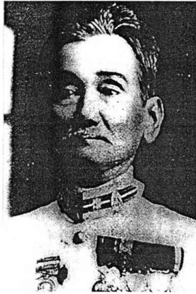
ภาพที่ 1 พระยาเสนาะดุริยางค์

ประวัติพระยาเสนาะดุริยางค์ (แช่ม สุนทรวาทีน) 2