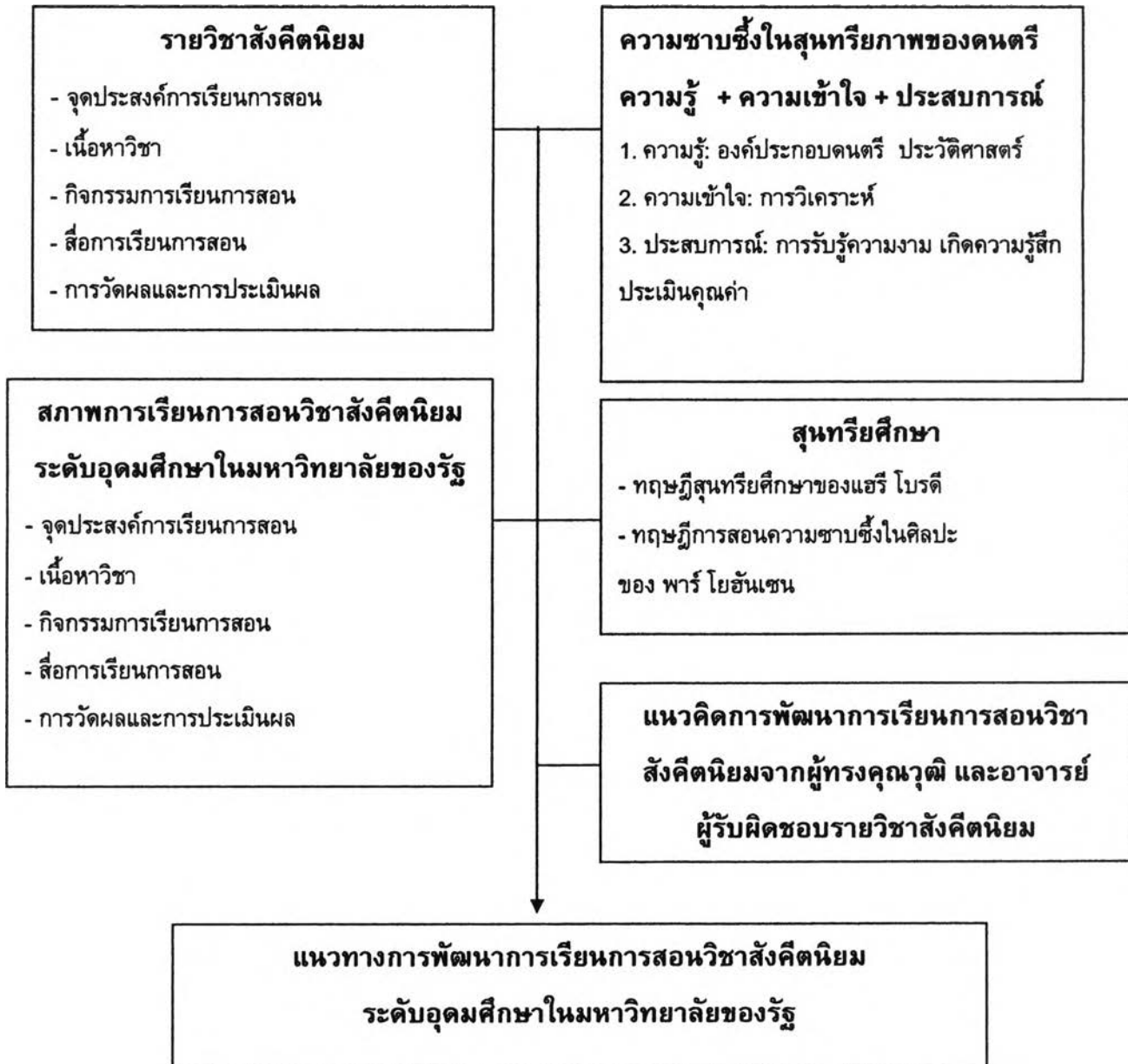
แผนภาพที่ 2.2 กรอบการวิจัย

จากการศึกษาเอกสารและงานวิจัยที่เกี่ยวข้องแสดงให้เห็นถึงองค์ประกอบของการพัฒนาการเรียนการสอนทั้งด้านเนื้อหาสาระสังคตินิยม ผู้สอนและผู้เรียน ซึ่งงานวิจัยฉบับนี้เน้นการพัฒนาการเรียนการสอนเพื่อส่งเสริมสุนทรียภาพแก่ผู้เรียน โดยนำหลักการด้านสุนทรียศึกษามาเป็นแนวทางในการพัฒนา ซึ่งสรุปเป็นกรอบการวิจัยได้ดังนี้