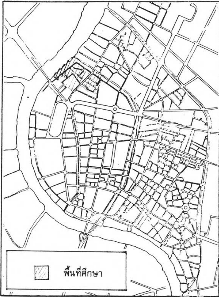
แผนที่ ๑.๑ แสดงตำแหน่งที่ตั้งและขอบเขตพื้นที่ศึกษา ย่านบางลำพู