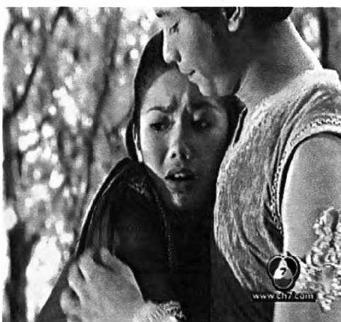
ภาพที่ 4.18 แสดงภาพฉากเข้าพระเช้านาง