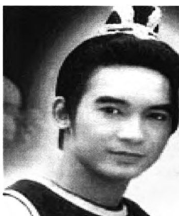
ภาพที่ 4.16 แสดงภาพนักแสดงหน้าใหม่

“สรุปว่าพอดูได้ แต่สู้พระราหูไม่ได้หรอก” (ฤกษ์ร้อน, Webboard 7 กรกฎาคม 2546)