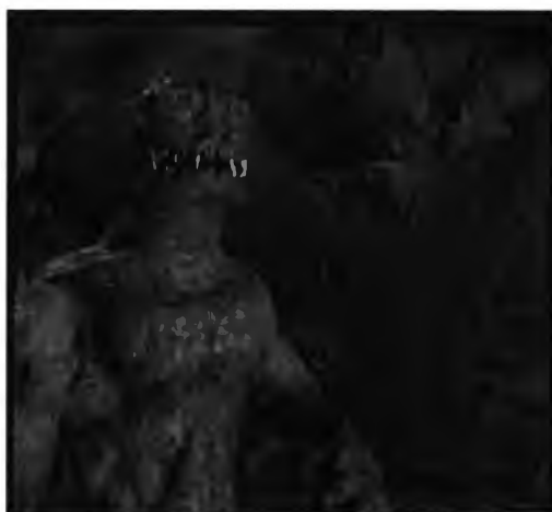
ภาพ 4.19 แสดงภาพตัวประหลาด

(คนชอบโปนกะแยมและจะชอบแจมส์ด้วย , Webboard 1 พฤศจิกายน 2546)