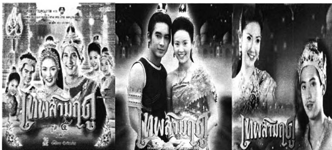
ภาพที่ 4.1 แสดงภาพคู่พระ-นางของเทพทั้งสาม