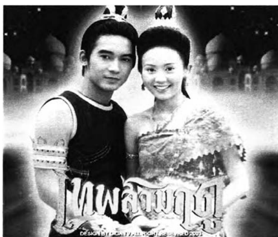
ภาพที่ 4.17 แสดงภาพเครื่องแต่งกาย

ในช่วงต่อมาของละครที่มีตัวแสดงนำในบทเด่นๆ เริ่มแสดงในละครเรื่องเทพสามฤดูแล้ว ผู้วิจัยก็ได้พบว่า ผู้ชมละครมีความต้องการและความปรารถนาที่จะได้เห็นดารานักแสดงที่ต้นชั้นชอบทั้งในสวนดาราใหม่ ดาราเก่าได้แสดงนำในเรื่องนี้ และผู้ชมพึงพอใจมากจากการได้ดูบทบาทของนักแสดงในเรื่องนี้จนมีพฤติกรรมติดตามเฝ้าชมละครต่ออย่างเหนียวแน่น ดังกระทู้เหล่านี้