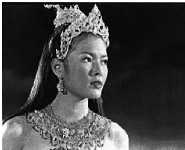
ภาพที่ 4.7 แสดงภาพจินดาเมขลา