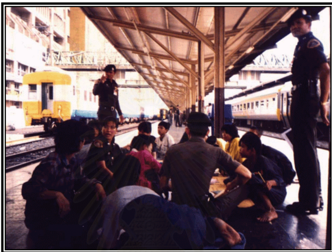
รูปภาพที่ 19 การปฏิบัติงานของครูตำรวจในอดีต