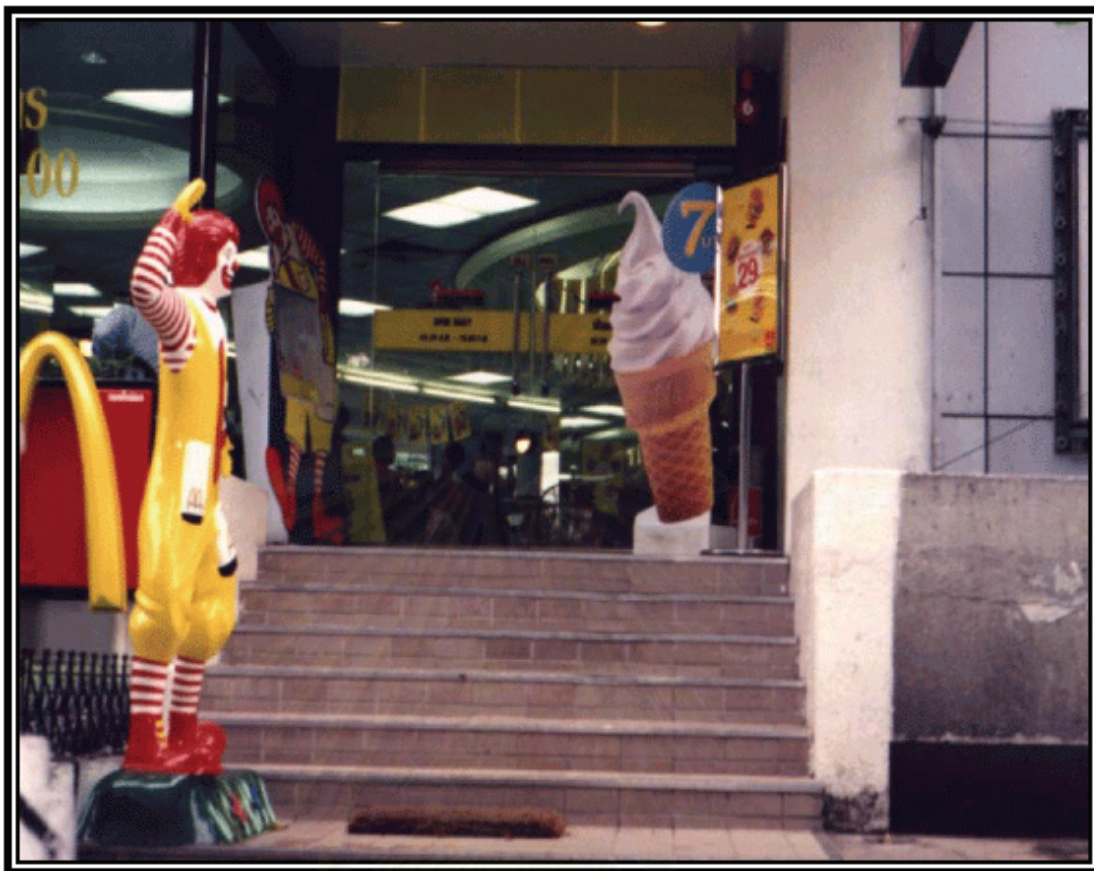
รูปภาพที่ 5 พื้นที่บริเวณหน้าห้างโรบินสัน สีม