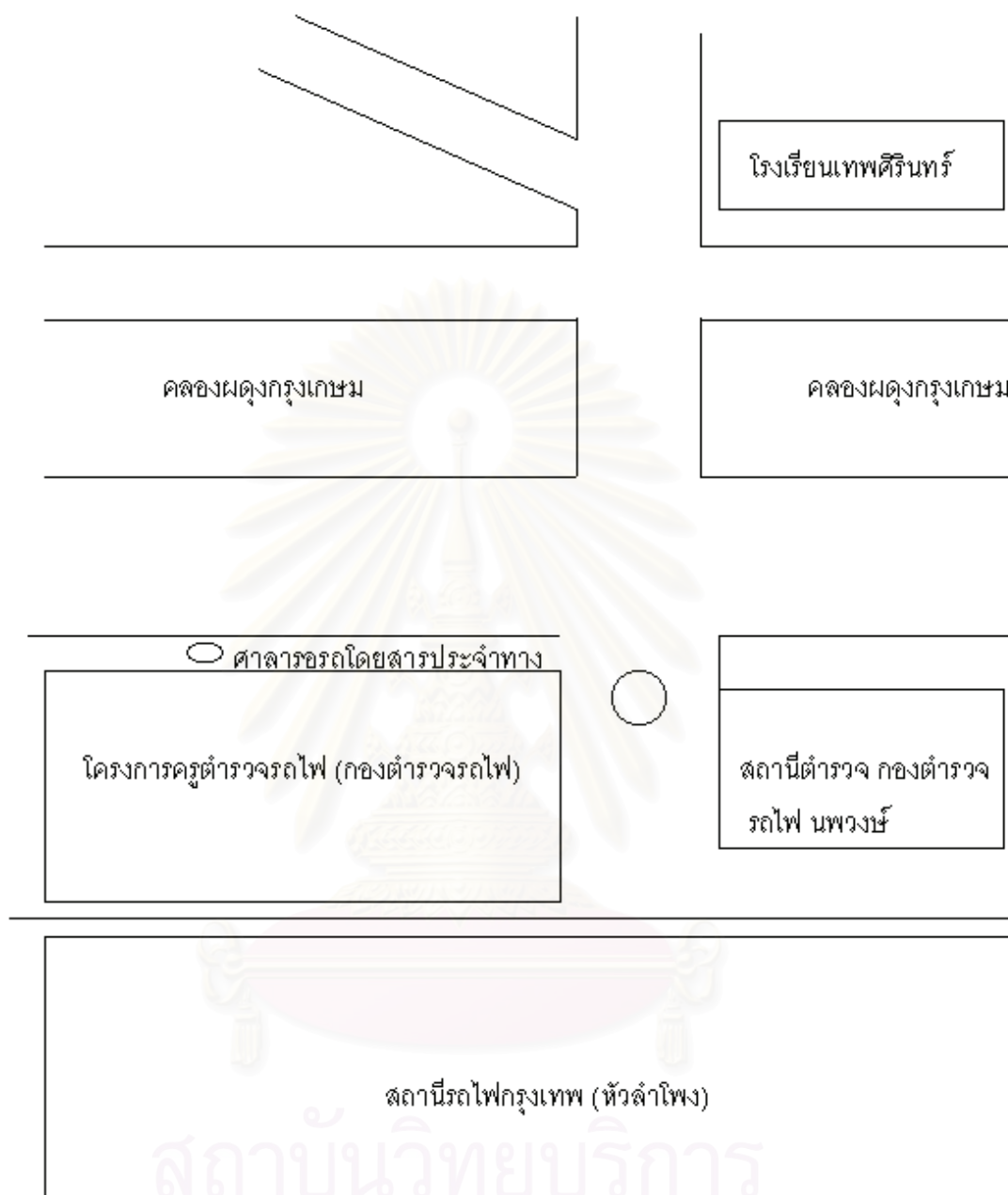
รูปภาพที่ 14 แผนที่ตั้งของโครงการครูดำรวจข้างถนน กองตำรวจรถไฟ