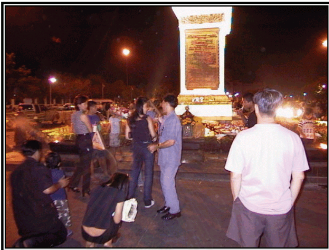
รูปภาพที่ 3 อีกรวมหนึ่งของพื้นที่บริเวณท้องสนามหลวง