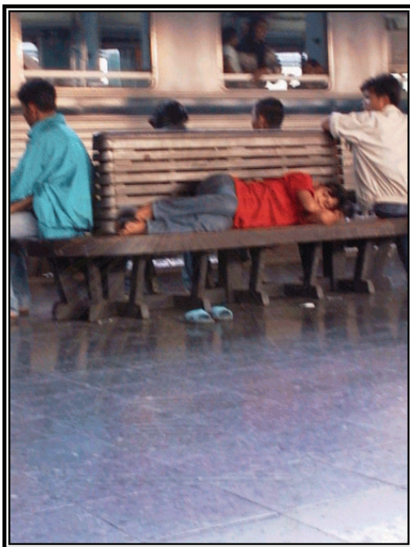
รูปภาพที่ 13 การอาศัยบริเวณชานชลาเป็นที่หลับนอนของเด็กเร่ร่อน