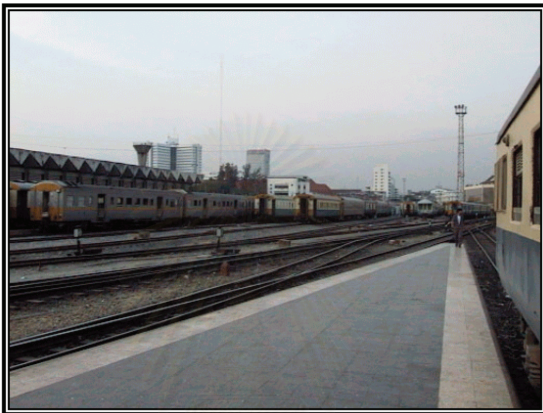
รูปภาพที่ 10 พื้นที่ใน "ย่าน" บริเวณสถานีรถไฟกรุงเทพ (หัวลำโพง)