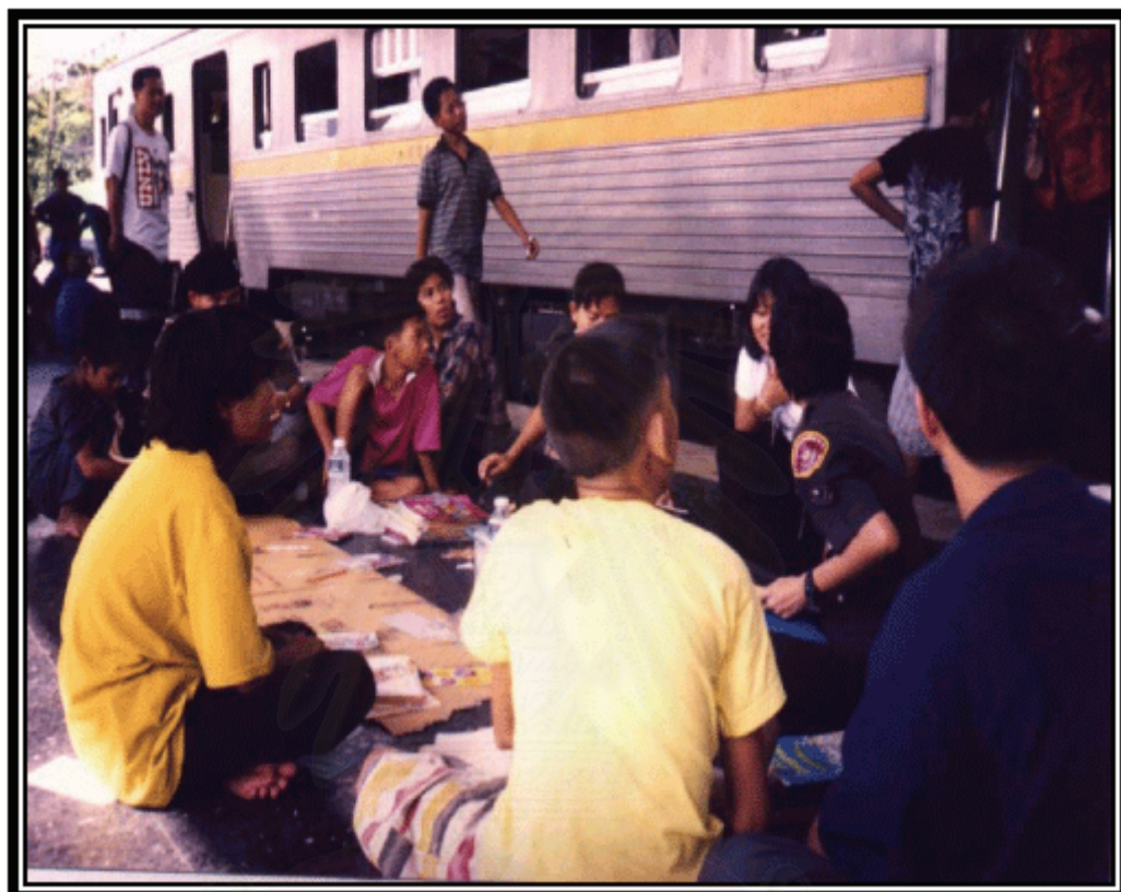
รูปภาพที่ 11 สถานที่ปฏิบัติงานของโครงการครูตำรวจรถไฟในอดีต