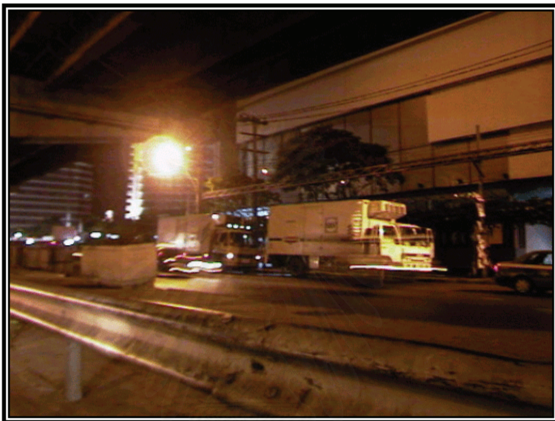
รูปภาพที่ 4 พื้นที่บริเวณสี่ลม (พัฒน์พงษ์)