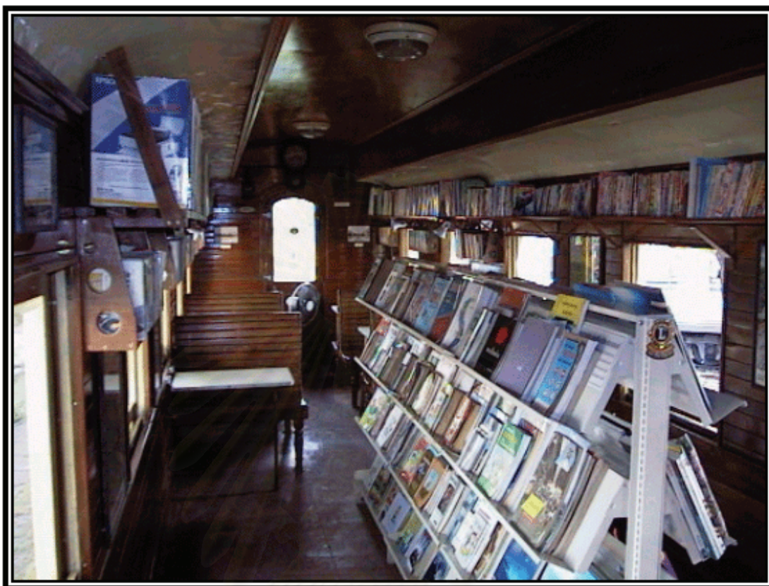
รูปภาพที่ 17 ห้องสมุดของโครงการฯ