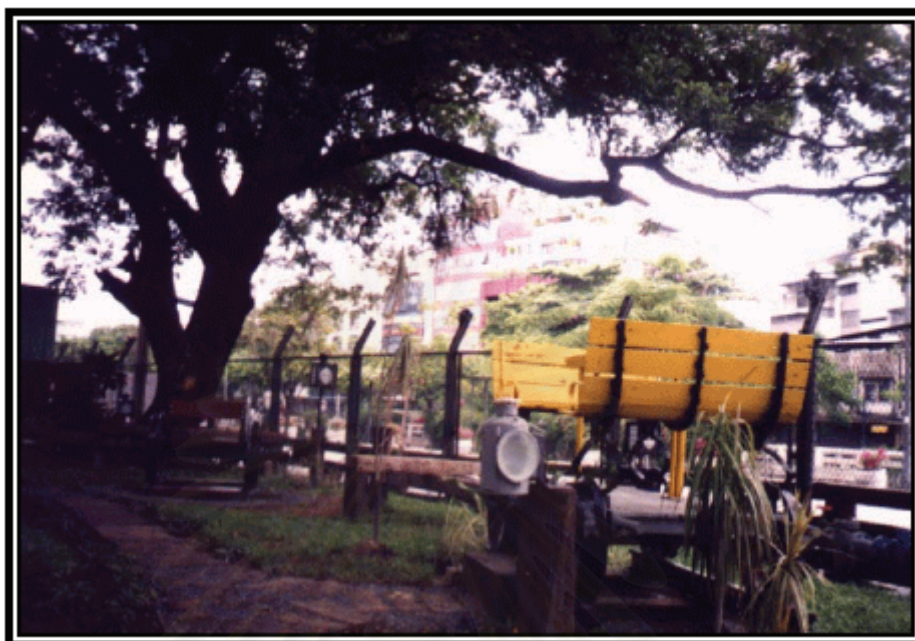
รูปภาพที่ 15 บรรยากาศโดยรอบโครงการฯ