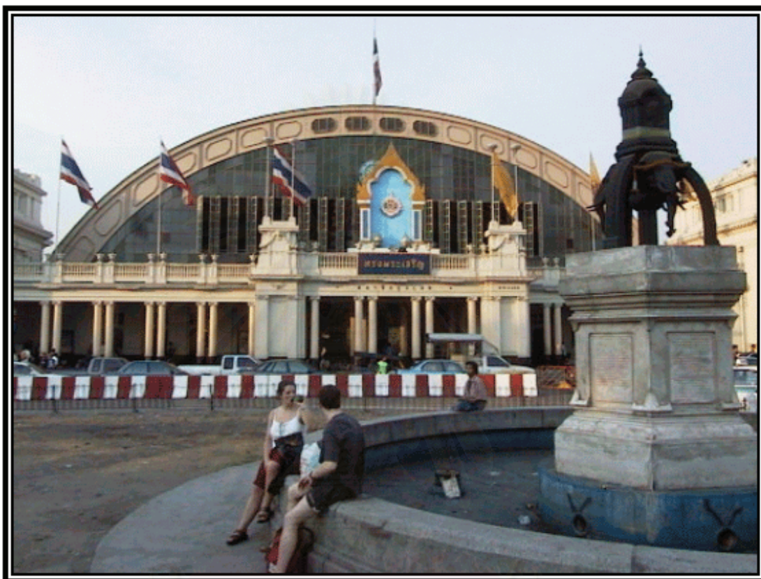
รูปภาพที่ 9 บริเวณ "หัวช้าง" และ "สามเหลี่ยม"