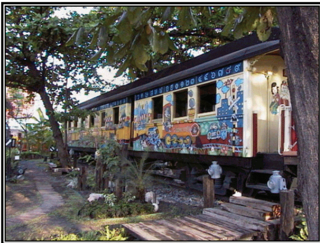
รูปภาพที่ 16 บรรยากาศอีกมุมหนึ่งของโครงการฯ