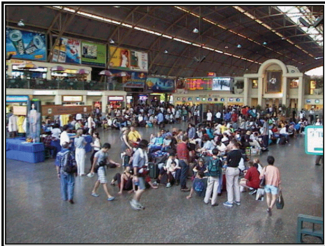
รูปภาพที่ 1 พื้นที่บริเวณสถานีรถไฟกรุงเทพ (หัวลำโพง)