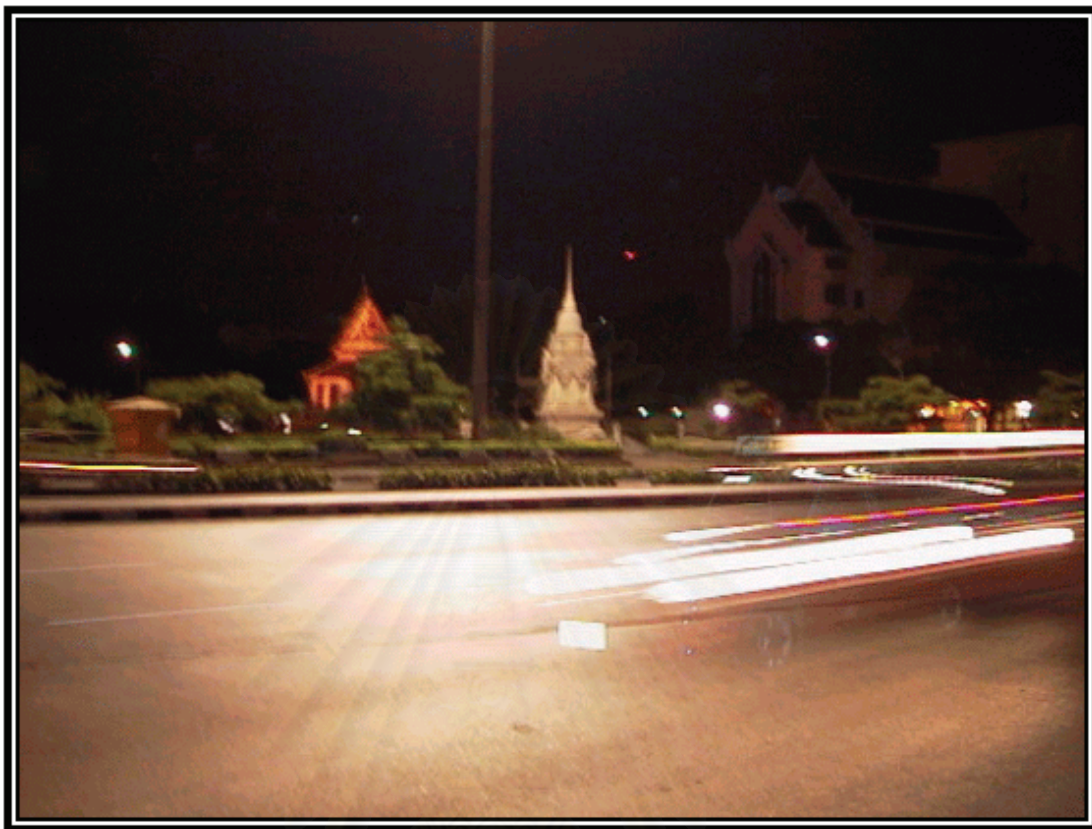
รูปภาพที่ 2 พื้นที่บริเวณท้องสนามหลวง