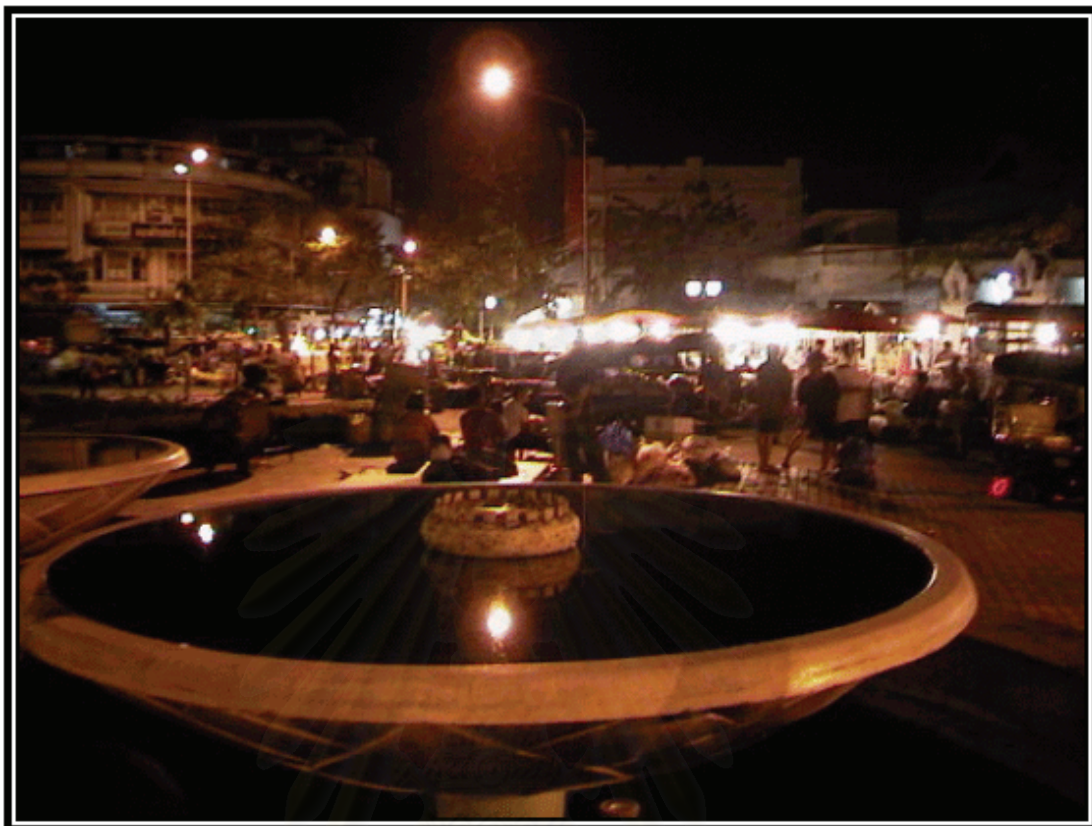
รูปภาพที่ 6 พื้นที่บริเวณสะพานพุทธ (ปากคลองตลาด)