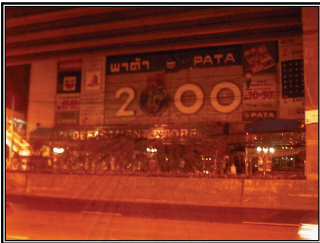
รูปภาพที่ 7 พื้นที่บริเวณหน้าห้างพาด้า ปิ่นเกล้า