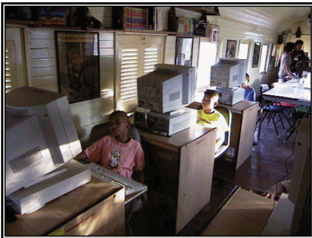
รูปภาพที่ 20 การใช้ห้องคอมพิวเตอร์ของเด็กเร่ร่อน