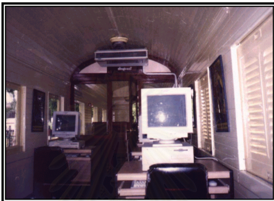
รูปภาพที่ 18 ห้องคอมพิวเตอร์ของโครงการ